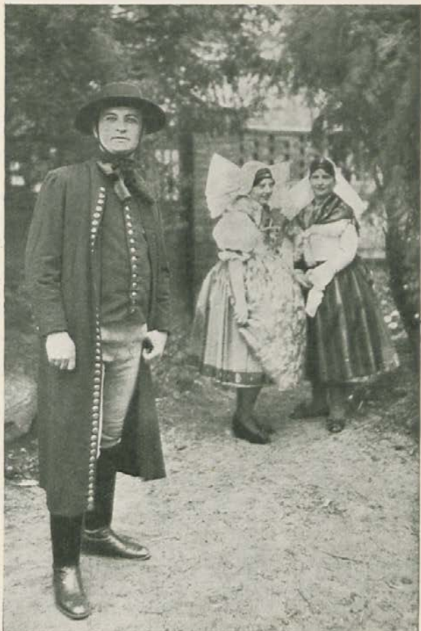
Prizor iz češke kmetiške svatbe

Nas bo vprizoritev tem bolj zanimala, ker bomo lahko primerjali češke svatbene običaje s svojimi, slovenskimi in vobče jugoslovanskimi. In nič se ne