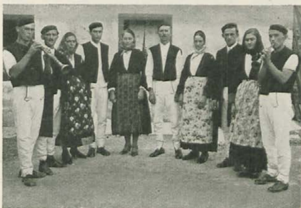
Istrska plesna skupina