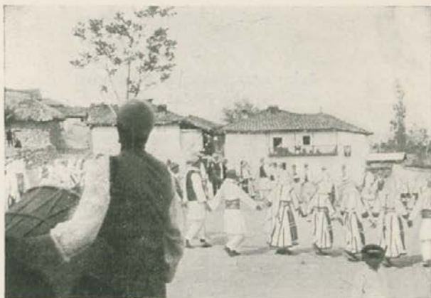
Kolo iz skopske Črne gore

Moro ji odgovarja, naj preneha s tožbami in naj se odloči, da postane njegova, ker je itak v njegovih rokah. Naj le pride njen dragi, da se pomerita v boju. Zaradi ljubezni do nje je pripravljen vse pretrpeti. Vsako željo ji usliši.