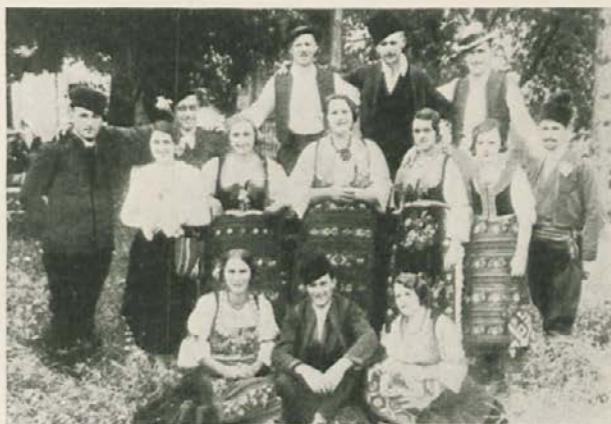
Plesna skupina iz Požarevca