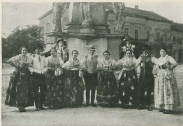
Bunjevačka plesna skupina