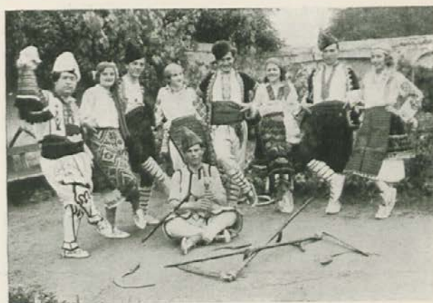
Bolgarska plesna skupina