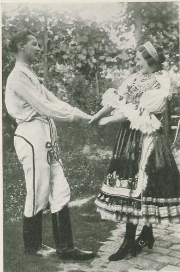
Slovaški plesni par

Baranjski v prekrasnih narodnih nošah bodo plesali staro baranjsko kolo,