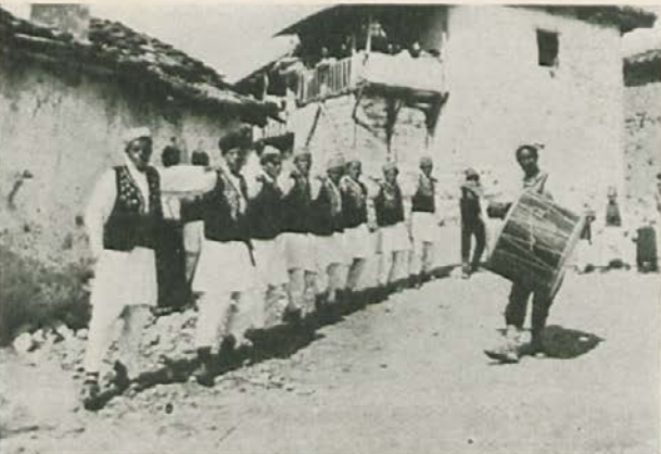
Kolo iz skopske Črne gore

je. Gospodarji mesta so nato bili Grki, Feničani, Iliri, Genovežani, Mlečani, ogrsko-hrvatski kralji, dubrovniška republika, Avstroogrška, Rusija, Francija in Angleška. Kljub tolikim gospodarjem pa je imela Korčula svojo avtonomijo in se je upravljala po svojem statutu od l. 1214.