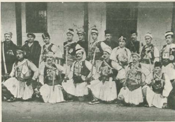
Rusalije iz Gjevngjelije

Pri zadnji kitici dvigne prva vrsta visoko sklenjene roke, vojarinka pa pelje svoje v ravni vrsti skozi ta most. Nato se vloge zamenjajo, naposled gredo vsi skozi most, pojoč »Črnooko