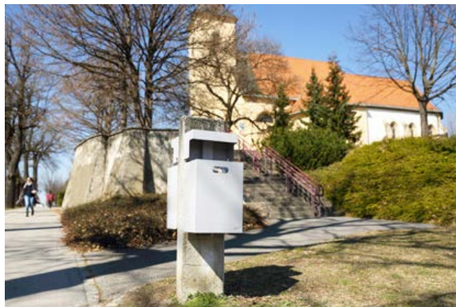
Pasji iztrebki sodijo med mešane komunalne odpadke, zato jih lahko odvržemo v vse obstoječe koše.

Odloki o javnem redu in miru, sprejeti v večini občin v Spodnjem Podravlju, so omogočili pristojnost za nadzor in ukrepanje nad vodniki psov tudi občinskim redarjem in občinskim inšpektorjem. V odlokih je določeno, da je zaradi varovanja zdravja in čistoče prepovedano puščati iztrebke domačih živali na javnih površinah, zaradi česar mora imeti vodnik psa pri sebi ustrezno vrečko za pobiranje iztrebkov, ki jo mora na zahtevo občinskega redarja ali občinskega inšpektorja tudi pokazati. Neupoštevanje teh določb se kaznuje z globo 100 evrov. Občinski redarji izvajajo naloge kot uniformirane osebe, zaradi njihove prepoznavnosti je težko ugotoviti kršitve nepobiranja pasjih iztrebkov.