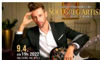
SOULGREG ARTIST & BIGLIGHTS BAND