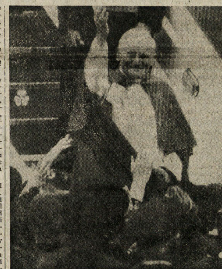
Papež Janez Pavel II. pozdravlja množico na irskem letališču Shannon pred odhodom v ZDA

BOSTON — Papež Janez Pavel II. je sinoči malo po 20. uri po italijanskem času prispel v Boston in s tem začel svoje prvo potovanje v ZDA. Na letališču so ga pričakali žena predsednika Carterja Rosalyn ter številni predstavniki krajevnih oblasti, med katerimi tudi senator Edward Kennedy. Sicer pa so v Bostonu sprejeli papeža z nepopisnim navdušenjem. Ob 35 km dolgi cesti od letališča do mestnega parka, kjer je papež maševal, se je zbralo več kot 2 milijona oseb z zastavami, prapori, transparenti in velikimi lepaki. Temu toplemu sprejemu bostonske množice je treba dodati tudi izredno pripravljen sprejem oblasti, predvsem Carterjeve žene, ki je dejala, da papež ne prihaja v ZDA kot tujec, kajti vsi vedo, kako je njegovo dosedanje delo »ganilo celoten svet«. V Bostonu menda ne pomnijo tako velike manifestacije, sicer pa je bilo treba tak sprejem tudi pričakovati, ker je Boston najbolj katoliško mesto na celini: približno 55 odstotkov od 659 tisoč prebivalcev je v Bostonu pripelo za to priložnost veliko steevilo tujcev, med njimi tudi precej iz Kanade.