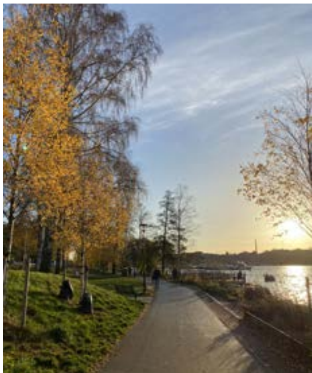
Jesen 2020 ...