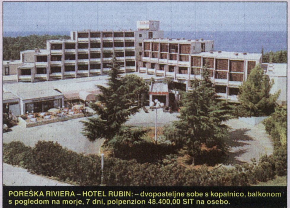
POREŠKA RIVIERA – HOTEL RUBIN: – dvoposteljne sobe s kopalnico, balkonom s pogledom na morje, 7 dni, polpenzion 48.400,00 SIT na osebo.

SAVUDRIJA – Montenegro: hišice za 4 osebe, TWC, polpenzion 3.900 SIT na osebo, otroci do 10 let imajo 30 % popusta.