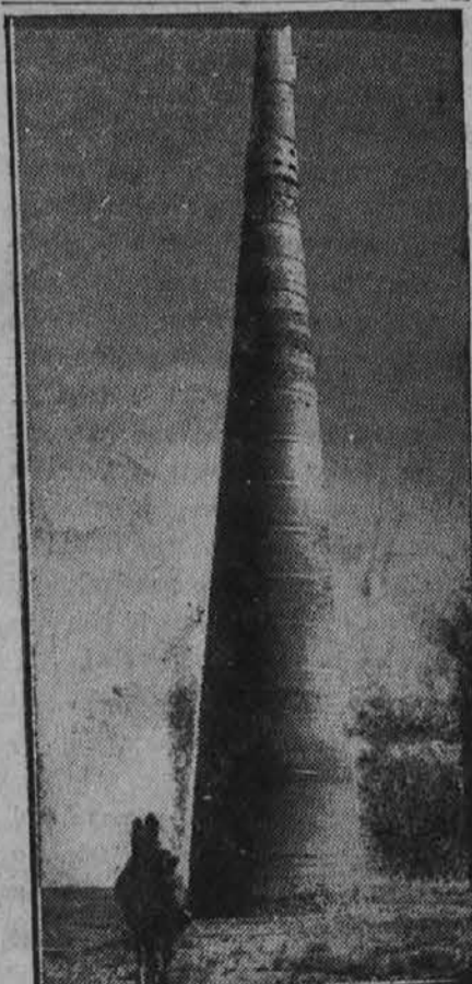
Stolp smrti: v vzhodu v Sumatrandu in Osrednji Aziji, metali na smrt obsojene kaznjence.