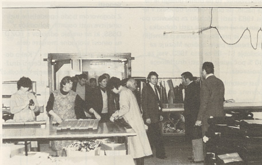
Člani izvršnega sveta SO Mozirje, ki so imeli v naši DO svoj delovni sestanek, med ogledom krojilnice

Čeprav se je oddaja začela z enourno zamudo, nam je bilo všeč.