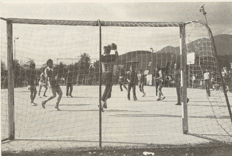
Tekma za prvo mesto

Tekmovanje je pokazalo, da se tudi v kegljanju lahko enakovredno borimo v občinskem merilu, četudi brez posebnih priprav. Rad pa bi poudaril, da je zavest nekaterih na zelo nizki stopnji, saj se kljub zagotovitom, tekmovanja niso udeležili.