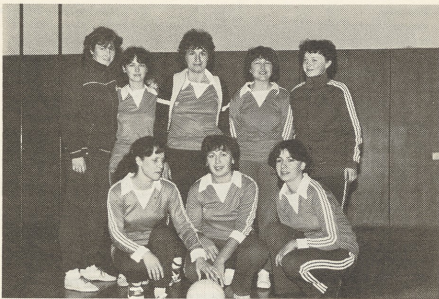
Že drugič zapored druge

Kaj hočemo, zmaga pač najboljši, zato sta pokala tudi letos odšla v prave roke. Z osvojenim drugim mestom pri ženskah in petim me-