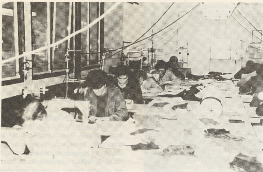
V decembru se je v delo uspešno vključilo 13 delavk VEZ Mozirje, TOZD Učila Bočna in zapolnilo veliko potrebo po novih delavcih

zdravstvene zaščite v pavšalnem znesku, mesto da bi se ta dajatev plačevala v odstotku 38 % od dejansko izplačanih plač. Podjetje je sicer vložilo prošnjo za znižanje stopnje socialnega zavarovanja ali pa znižanje osnove, vendar po 4 mesecih še ni prejelo rešitve, dasiravno je bil od strani Zavoda poslan revizor, ki je ugotovil dejansko stanje tega problema, ter predložil znižanje.