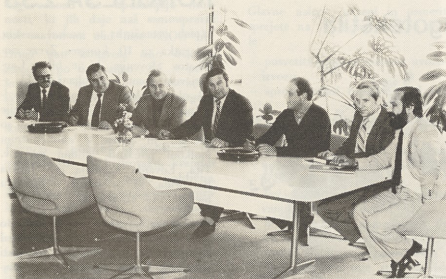
Zadovoljni obrazi pričajo, da je sporazumevanje potekalo brez zapletov