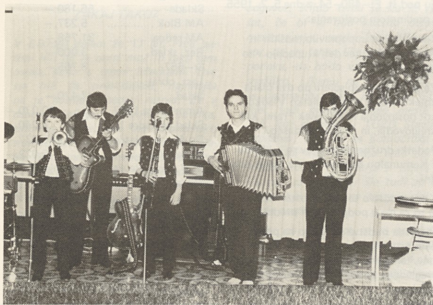
Ob poskočnih vižah ansambla "Zeme" so nas zadržali podplati

Že dolgo ni bilo nič napisanega o naši OO ZSMS zato je prav, da ta dolg poplačamo vsaj ob koncu leta. Res je bilo malo slišati o delu mladinske organizacije, vendar je ta kljub temu delala. Organizirani sta bili dve delovni akciji, katerih se je udeležilo kar lepo število mladincev in tako pripomglo k lepšemu okolju naše DO.