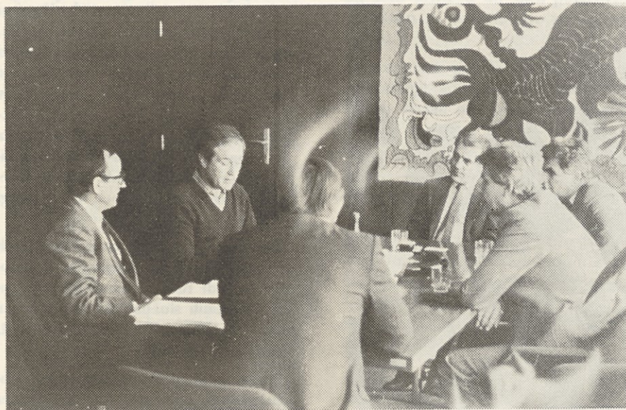
Gostje iz BiH so pozorno prisluhnili težnjam naše DO

S tem samoupravnim sporazumom si DO ELKROJ zagotavlja proizvodnjo smučarskih hlač za svoje tržne potrebe, tako za domače kot tudi inozemsko tržišče.