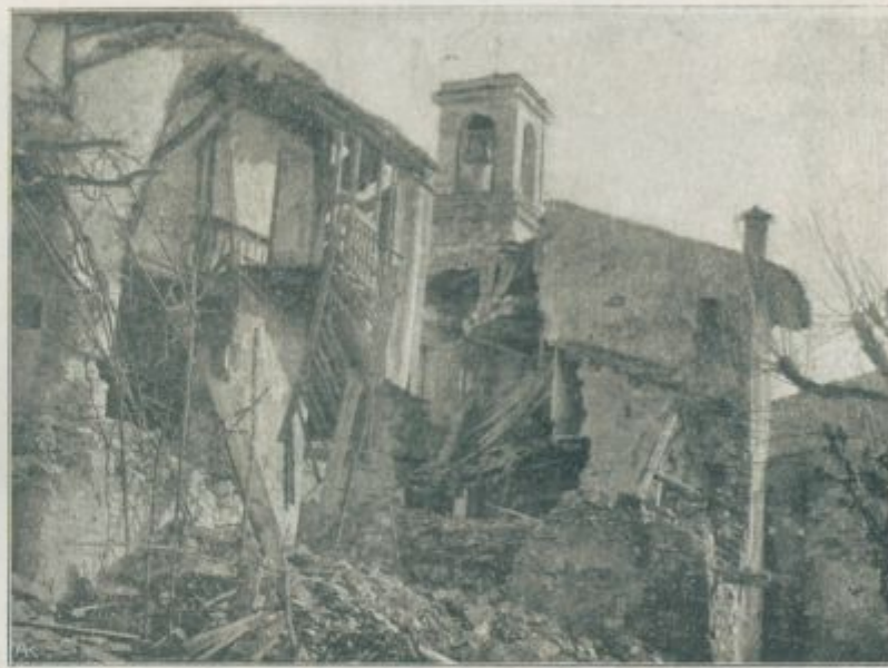
Jugozapadno bojišče: Gorica po četrti laški ofenzivi.

In vedno dalje je šla naša vojska proti Ivangorodu. Devet dni, devet noči skoro vedno na konju, po 50 km na dan, vedno v obleki in le redko nekaj ur spanja za