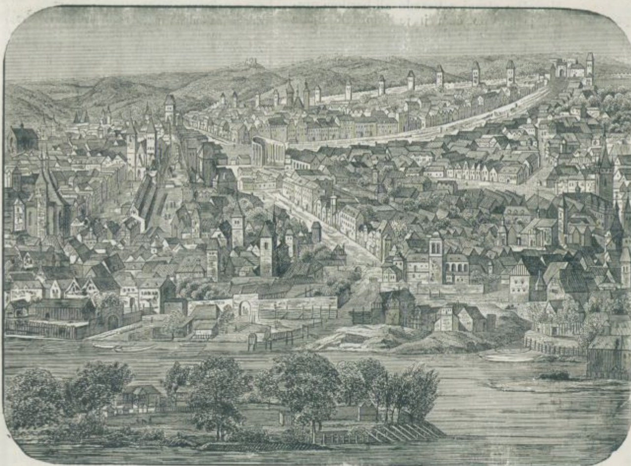
Mehika — kjer se razpleta najnovejša vojna Zedinjenih držav.

Zdi se, da po teh odločitvah bi bil naraven konec vojske. Bližnja prihodnost pokaže, v koliko je stvar dozorela.