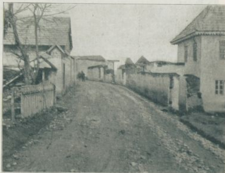
Vhod v mesto Rogatica na Hrvaškem.

12. marca. Na laškem bojišču so bili zadnje dni hujši topniški boji. Pri Doberdolu so se razvili tudi boji z minami in ročnimi granatami. Pod ognjem laških top-