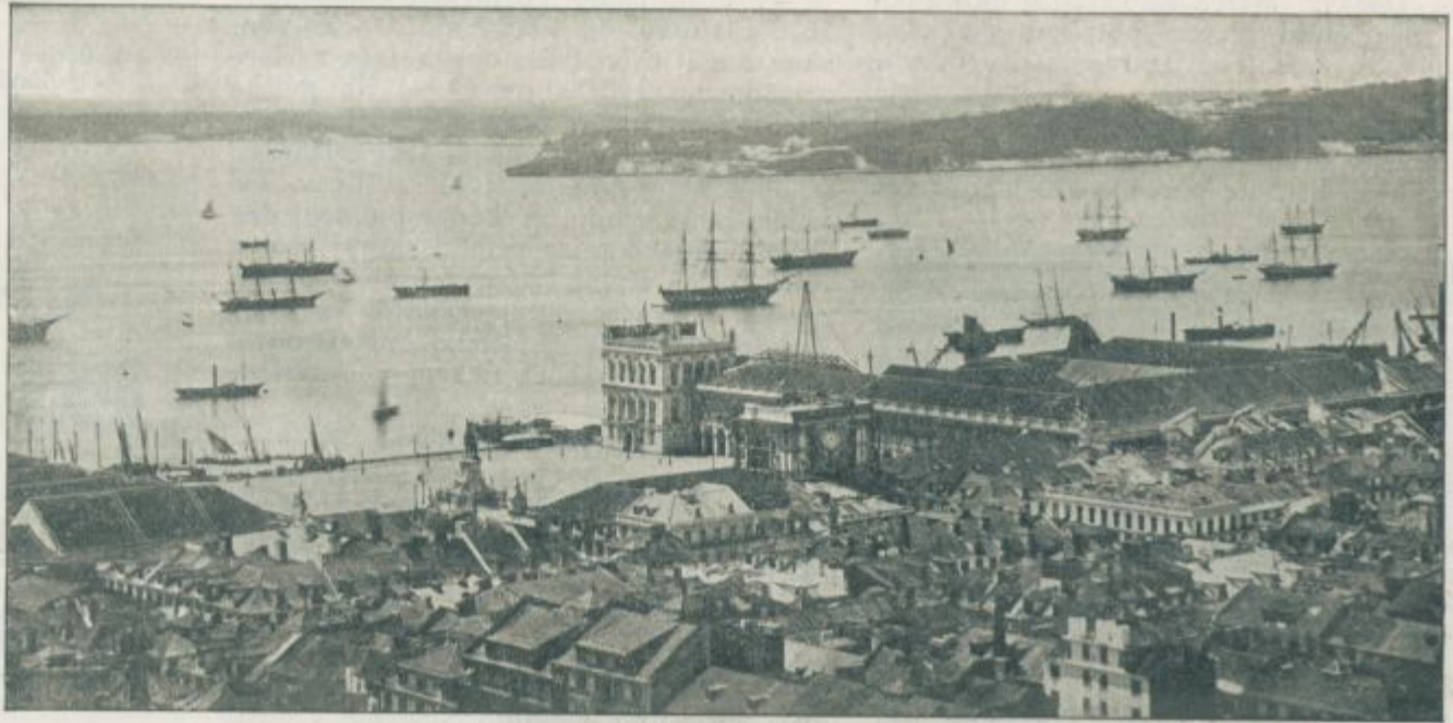
Portugalska v vojnem stanju: Lizabonsko pristanišče.