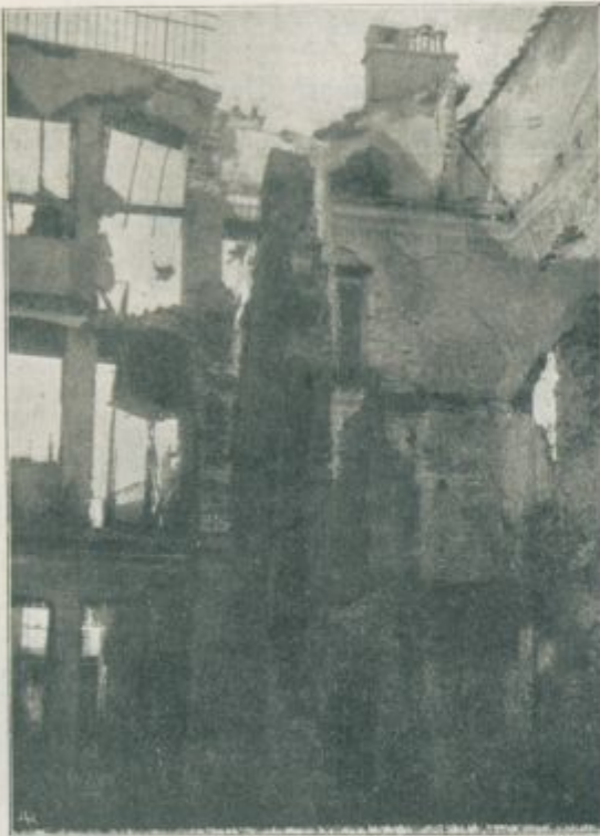
Gorica: Hiša po četrti laški ofenzivi od 2. do 15. novembra 1915.

Sto in sto organskih zvez nastaja, ako z destilacijo premoğa dobimo teer