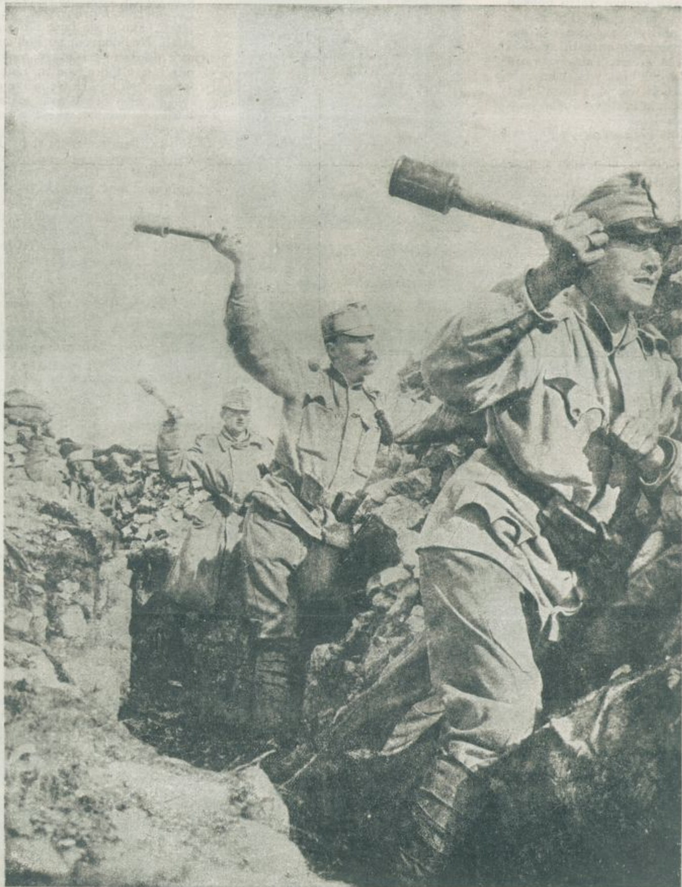
Naši vojaki v zakopih v bojih z ročnimi granatami.

LETNIK 2. * 23. MARCA 1916 - IZHAJA VSAK ČETRTEK * ŠTEV. 30