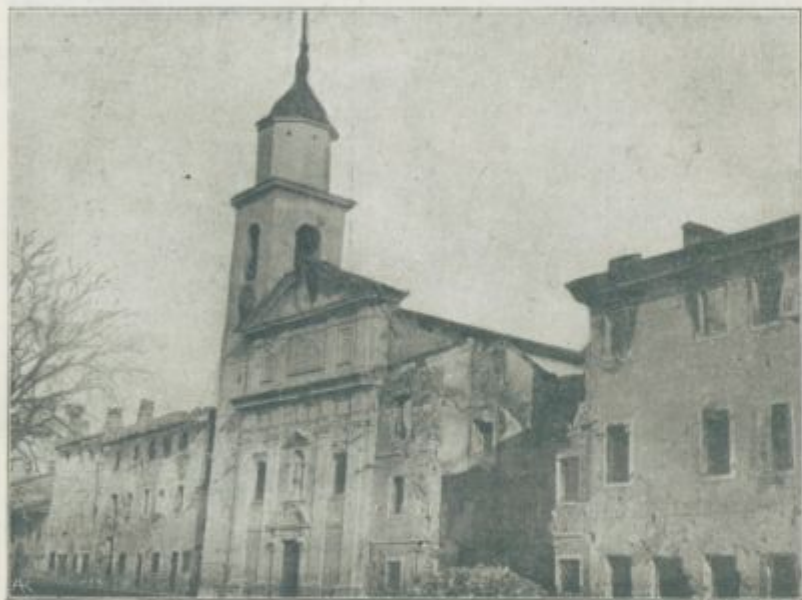
Jugozapadno bojišče: Cerkev na Placuti v Gorici.