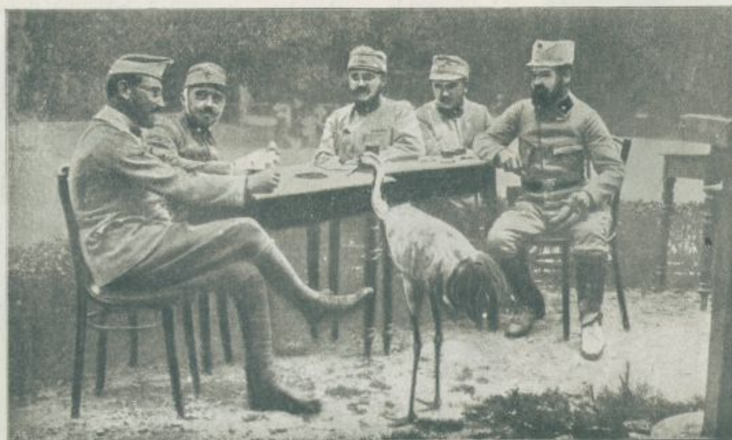
Krotki žrjav v vojaški družbi.

Še večja nego v Rusiji, je za premog sila v Italiji. Ker ni premoga, so morali ustaviti na Laškem vsaj deloma promet po železnicah; posebno je omejeno tudi razsvetljevanje ulic po laških mesih. Počivati morajo velika obrtna podjetja, tudi podjetje za pridobivanje žveplene rude v Siciliji. In če se vprašamo, zakaj se tako malo sliši o laški mornarici, tega ni kriv le strah pred našimi podmorskimi čolni, temu je še bolj krivo pomanjkanje premoga. S tem se tudi Lahi tolažijo, češ, če bi mi imeli dovolj premoga, bi bili Adrija in Albanija že davno naši. Italija je rabila premoga povprečno na leto devet milijonov ton, ki jih je dobila iz Nemčije in od Angleške.