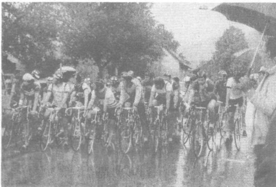
Kljub gneči na startu ni bilo težav

Torej bo v perspektivi teh letovišč čedalje manj. V Pacugu pa se nam obeta stalna rešitev omenjenega območja, ki je v projektu za severni Jadran namenjeno kot rekreacijski prostor za otroke in mladino. Upamo, da bodo s pobudo predsedstva OK SZDL uspeli, seveda ob pomoči in sodelovanju občanov in delovnih ljudi samoupravno organiziranih v KS in OZD naše občine.