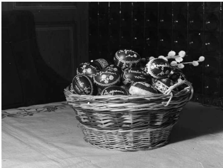
Negativ za izdelavo velikonočne voščilnice. Viden je paspartu, ki je nalepljen na negativ, z njim pa so določili izrez.

Največ posnetkov je iz Ljubljane (prevladujejo motivi ljubljanskih ulic in trgov, poleg tega pa so tudi posnetki kopališča Ilirija in kopališča na Ljubljani, parka Tivoli, gradu Tivoli in Fužinskega gradu, mednarodnega mladinskega kongresa na Plečnikovem štadionu za Bežigradom (1938), slovesnosti ob odkritju spomenika kralju Aleksandru na Kongresnem trgu (1940), Ljubljanskega velesejma, narodnih noš ...). Poleg posnetkov iz Ljubljane pa so posnetki še iz drugih slovenskih krajev (Maribor, Žužemberk, Celje, Rakek, Vrhnika, Hrastnik, Vrhnika pri Ložu, Cerknica, Cerkniško jezero, Begunje pri Cerknici, Višnja gora, Gornji grad, Novo mesto, Gornja Radgona, Murska Sobota, Ptuj, Radenci, Bled, Bohinj, Naklo, Solčava, Laško, Videm pri Krškem, Brežice, Borovnica, Logatec, Žiri, Metlika, Kočevje, Kamnik, Vršič, Škrlatica, Golica, Razor, Vogel, Planica-Tamar, Pokljuka) in nekaj posnetkov iz Hrvaške (Crikvenica, Malinska, Rab, Split, Trogir, Zagreb).