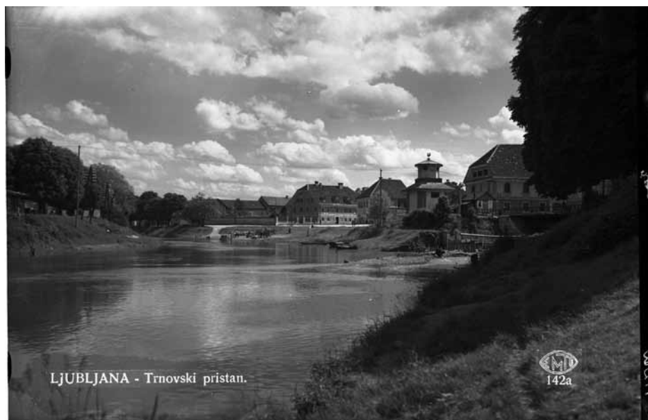
Negativ za izdelavo razglednice Ljubljane z motivom Trnovskega pristani. Desno spodaj sta vidna napis EMTE in številka negativa, levo spodaj pa motiv razglednice.