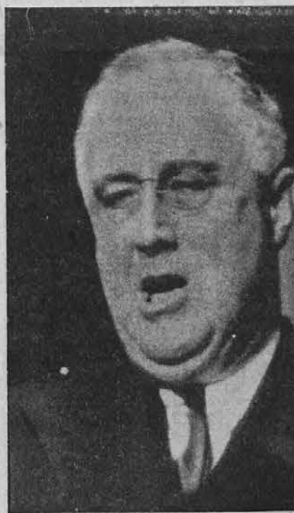
Roosevelt, državni predsednik Združenih držav

Ta teden so se vršile velike debate v francoskem in angleškem parlamentu. Obema vladama predbacivajo, da so premalo energične. Na ta pritisk so se odločili, da bodo obe vladi notranje reorganizirali ter je pričakovati, da bosta Francija in Anglija prešli iz defenzive v ofenzivo.