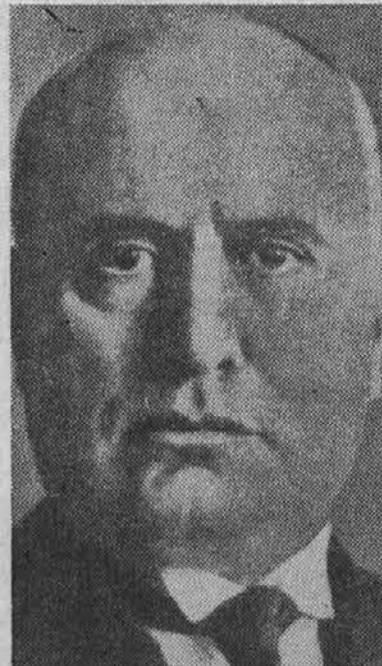
Benito Mussolini, italijanski vodja, ki se je te dni sestal s Hitlerjem

ske klanje Alaha, Budhe in še tisoče verskih božanstev.