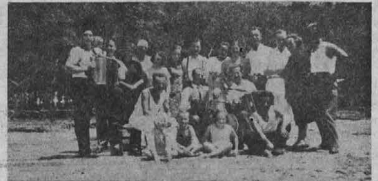
Naši rojaki, zbrani v veseli družbi v Villa Dominico