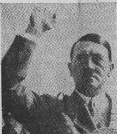
Adolf Hitler, nemški diktator

5) Nemčija dobi nazaj svoje kolonije v teku 25 let, ali vsaj mora ime-