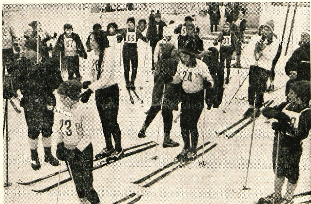
Učenke in učenci gorenjskih osnovnih šol na štartu smučarskega teka v Lancovem. Proga je bila zahtevna, vendar dobro pripravljena.

Besedilo: J. Košnjek