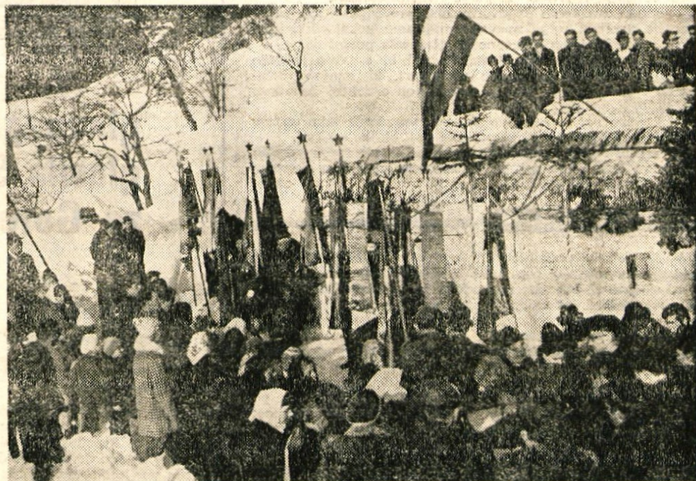
Komemoracija na dražgoškem pokopališču