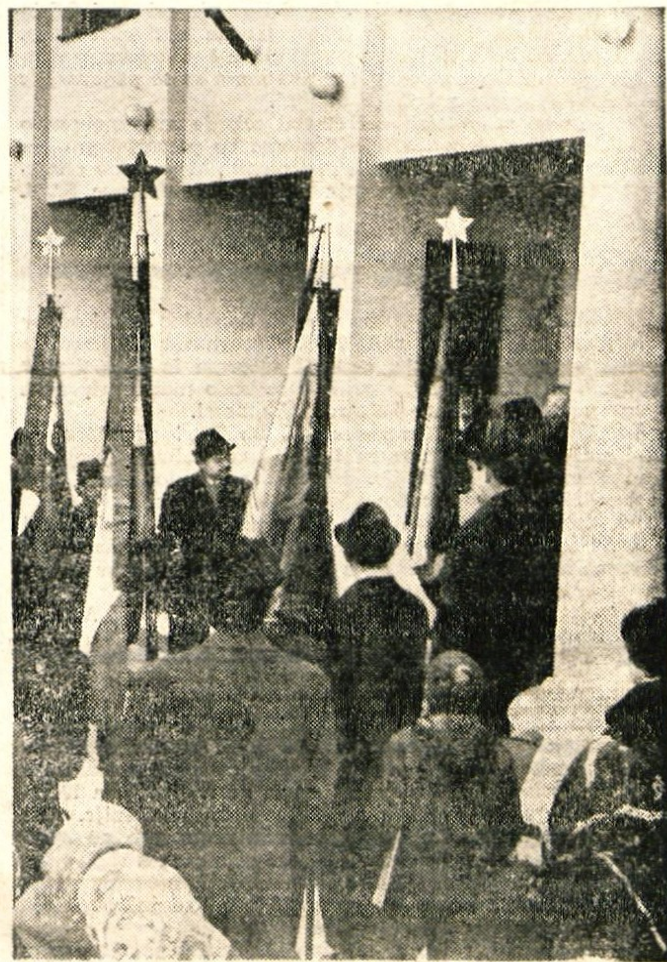
Odkritje spominske plošče 15. žrtvam NOB iz Češnjice