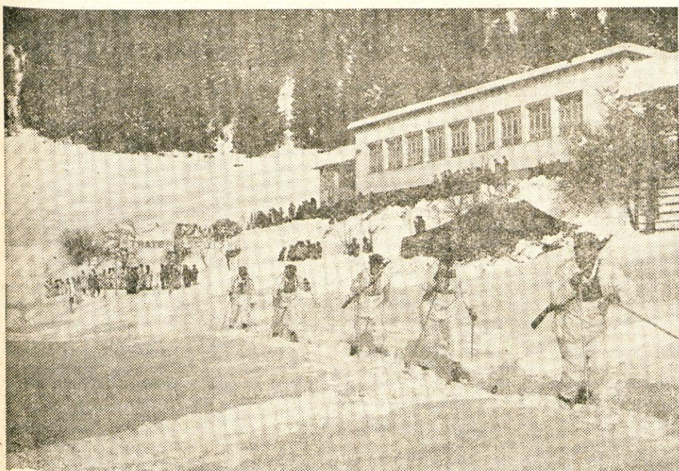
V Dražgošah je tekmovalo 11 desetčlanskih patrolj in enot JLA.