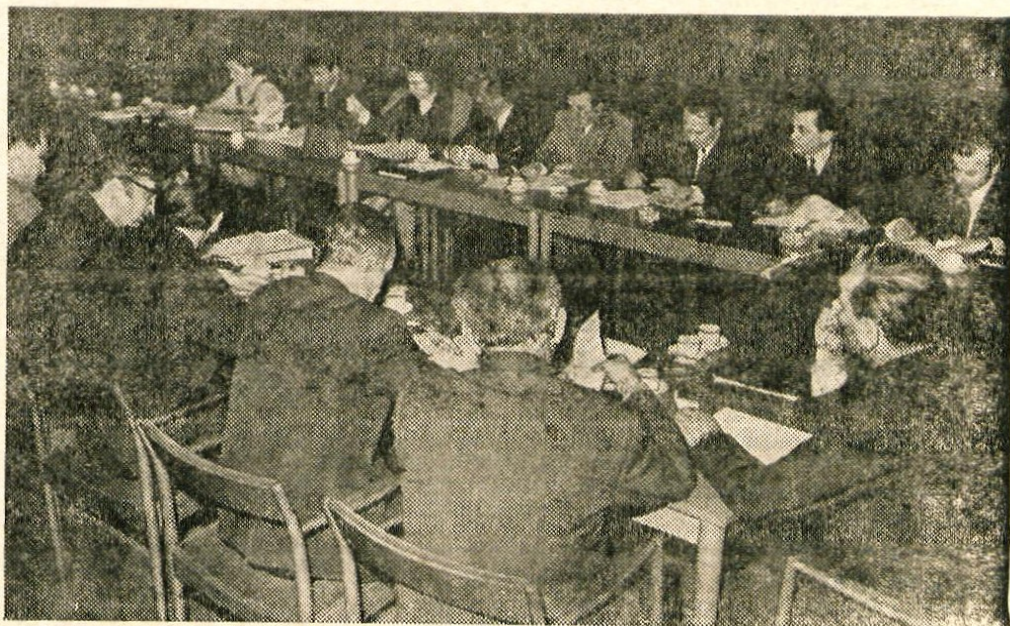
Medobčinski svet ZK za Gorenjsko je v ponedeljek popoldne razpravjal o težah za 18. sejo CK ZKS