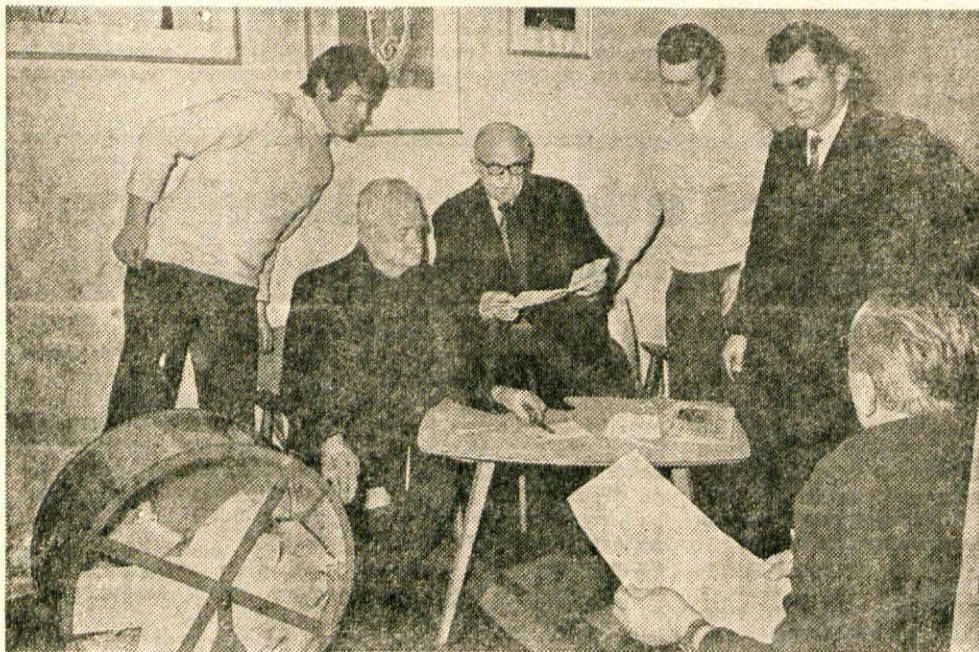
Napeto pričakanje: križanka je bila izžrebana, zdaj je pa treba preveriti, če je pravilno rešena.

Čeprav je zima, alpinisti z Jesenic, iz Mojstrane, Tržiča, Ljubljane in Celja ne mirujejo. Pripravljajo se za zimske vzpone. Še pred pomladjo nameravajo premagati severno steno Špika, severno steno Triglavu, Zmajev greben v trentarskih hribih in druge poti v Julijskih Alpah.