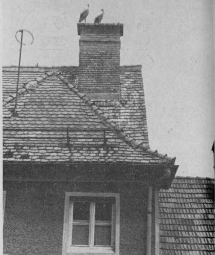
Pred nekaj dnevi sta se utaborili na dimniku ptujskega magistrata štorckli in nekaj dni uživali njegovo gostoljubje. Vendar jima nekaj ni ugajalo in nekoga lepega dne ju je zmanjkalo.

Stara Betty Coyinde je sklenila sestaviti oporoko. Ze dvajset let je bila vdova in pred kratkim je dočkala petinsedemdeset let.