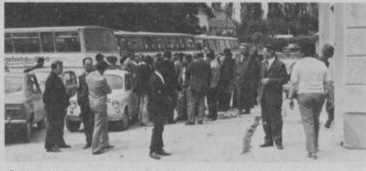
Člani ZROP iz občine Sisak so prispeli v Slov. Bistrico

Kljub slabemu vremenu pa se niso dali motiti v veselem razpoloženju, ki je vladalo ves čas njihovega skupnega bivanja v občini. Ob tej priložnosti so povabili svoje nove prijatelje v občini Slov. Bistrica, da v prihodnjem letu obiščejo v prav tolikšnem ali celo večjem številu njihovo občino. Uspeh prvega srečanja pa je nekateri že spodbudil, da bi to sodelovanje članov ZROP razširili še na nekatere druge slovenske in hrvatske občine.