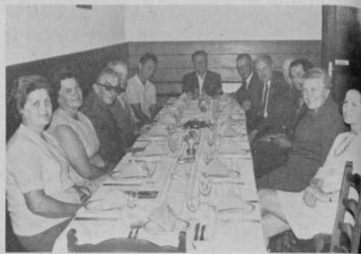
Odlikovanci so se skupaj z nekaterimi gosti zbrali v lovski sobi hotela Jeruzalem.