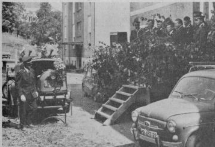
Nova brizgalna za gasilsko društvo Miklavž.

Slovesnosti ob krajevnem prazniku so Miklavževčani končali z gasilskim slavnjem. Popoldne ob 14.