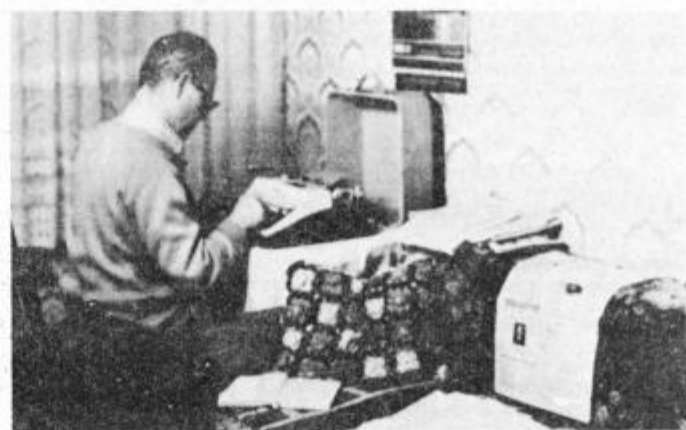
Jubilant je vedno pri delu

O vsej svoji družbenopolitični aktivnosti ne bi govoril ker o tem