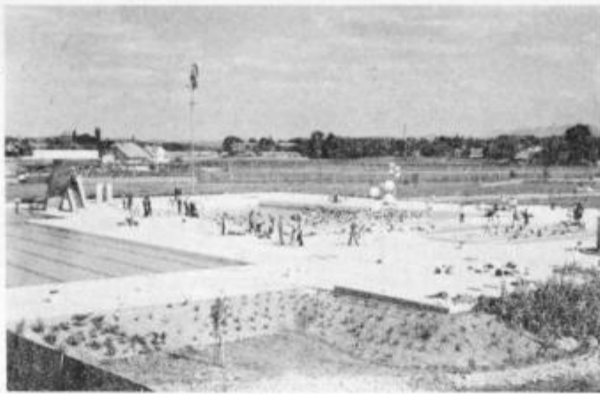
Ptujске toplice — tudi med prvomajskimi prazniki živahno