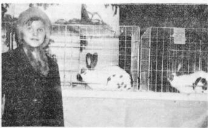
Pasemski kunci so bili prava paša za oči