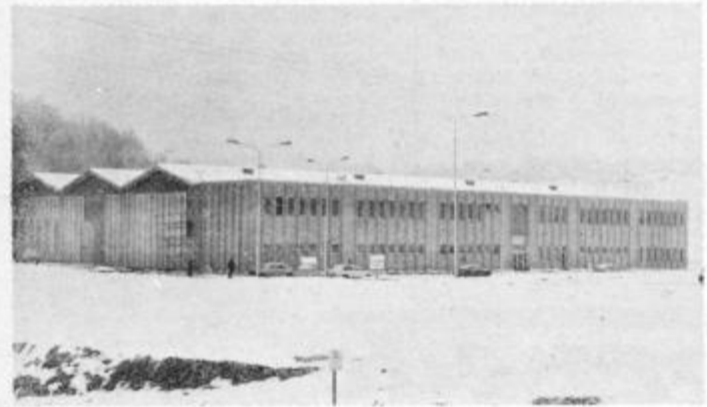
V tovarni se bodo zaposlili tudi delavci, ki so bili na začasnem delu v tujini

V soboto bodo v Dolanah, v odprli novo tovarno krajevni skupnosti Cirkulane hidropnevmatike in strojev.