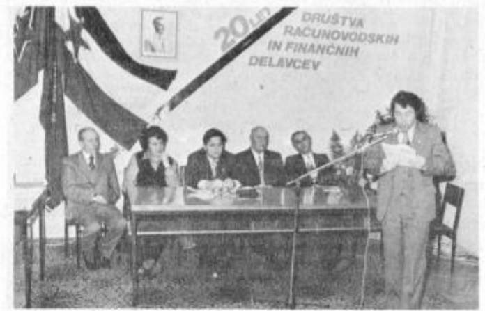
Člani delovnega predsedstva na proslavi ob 20-letnici društva

Društvo šteje danes že 728 članov, pripravljajo pa se tudi na sprejem novih članov. Za primeren opis 20-letnega dela so v društvu izdali poseben zbornik in bodo z