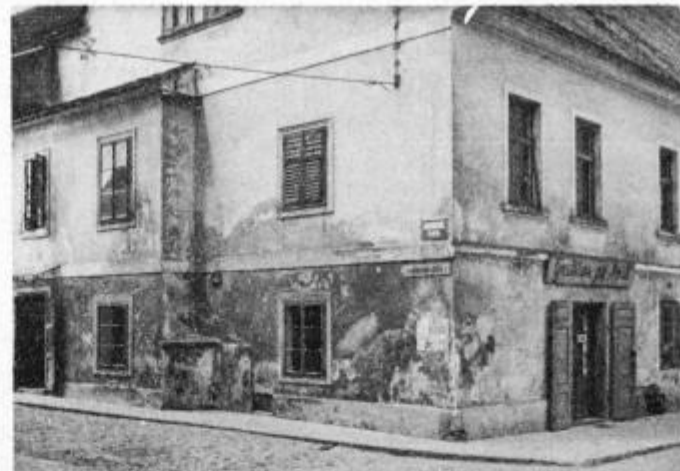
Gostilna „Pri pošti“, kjer je bil septembra 1928 (v posebni sobi zadaj levo) ustanovni sestanek celice KP v železniških delavnicah

Potrča je obtožnica bremenila, da je aktivni član KPJ. Kazen je prestajal v Požarevcu. Leta 1936 je bil spet aretiran, odpeljan v Zagreb in tam zverinsko mučen. Ker ni ničesar priznal, so ga čez štiri mesece izpustili. Od januarja do konca marca 1941 je prebil v koncentracijskem taborišču v Medjurečju v Srbiji, kjer je buržoazna oblast internirala na stotine komunistov in drugih napred-