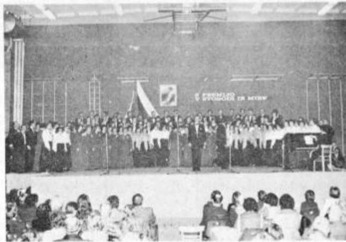
Združeni zbori so revijo končali s skupnim nastopom.

Čutimo dolžnost, da se zahvalimo vsem, ki so pomagali, da je prireditev lahko bila izvedena to je vodstvu in dijakom Poklicne kovi-