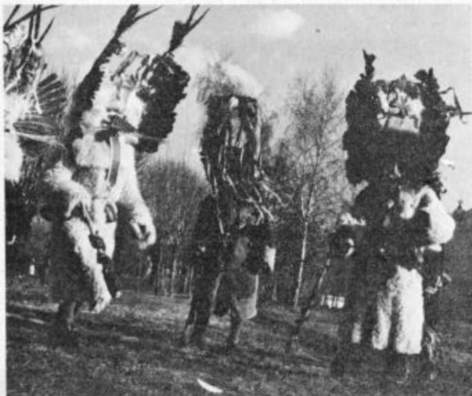
Koranti s Ptujskega polja

Letos smo v Ptujju ob 85. jubileju muzeja odprli tudi etnološko zbirko maske in opravila, ki bi morala v bodoče preiti v nacionalni slovenski muzej mask.