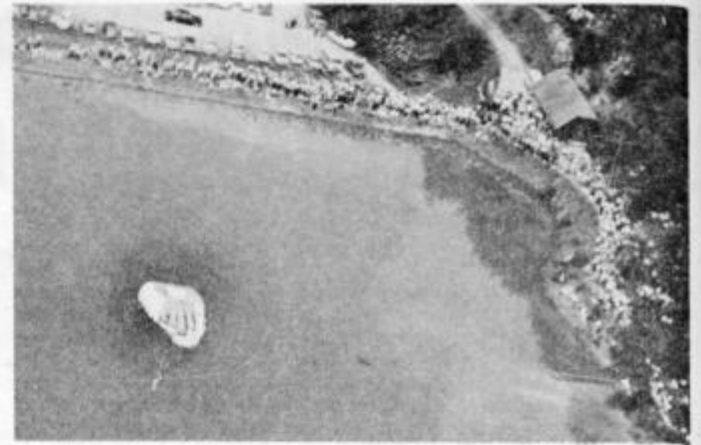
Skoki v vodo, vsakoletno tekmovanje za Ptujski padalski pokal v organizaciji Aerokluba Ptuj, vsako leto privabi k ribniku v Podlehniku veliko obiskovalcev