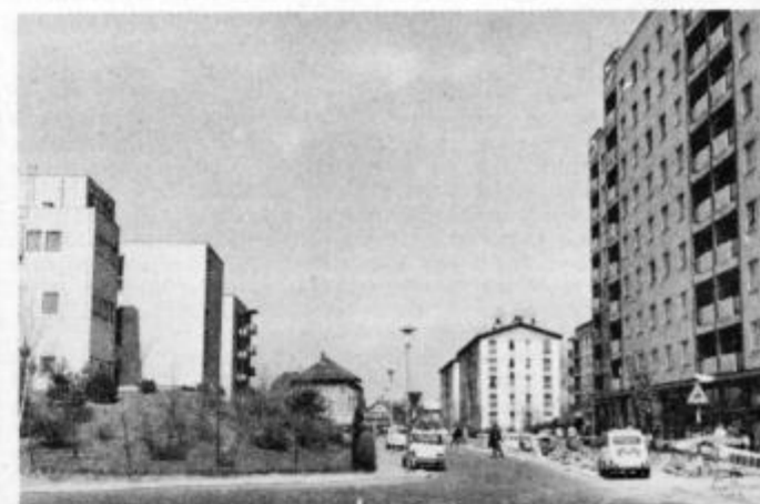
Potrčeva ulica v Ljubljani