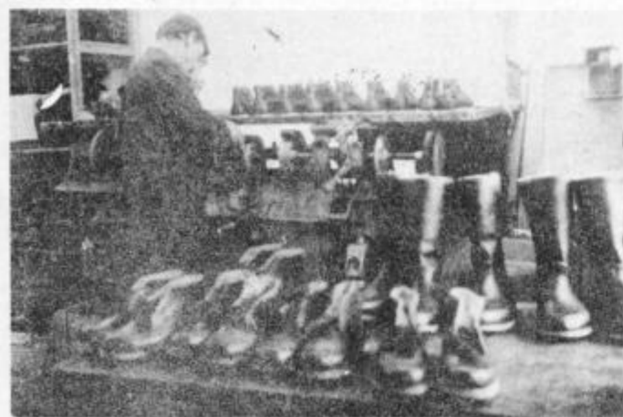
V čevljarski delavnici v Kidričevem delajo predvsem zaščitno obutev.

Čeprav smo danes vajeni kupovati čevlje le v trgovinah s čevlji, vseeno ne smemo pozabiti tistih, ki še vedno precej dela bodisi pri navadnih ali zaščitnih čevljih opravijo ročno in ob tem mnogim tudi zakrpajo ali popravijo stare čevlje. Eni od takih, ki pridno delajo, so tudi marljivi čevljarji iz čevljarske delavnice Kidričevo, ki vladno sprejemajo svoje stranke in jim tudi ugodijo v njihovih željah in predvsem potrebah.