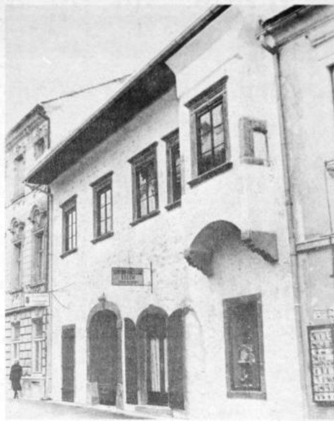
Poznogotška meščanska hiša, v pritičju vidno gotško okno.