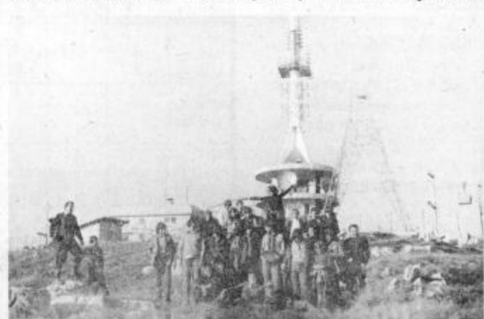
Lanskoletni tečajniki PD Kidričevo na vrhu Uršlje gore pri TV pretvorniku Plešivec

Za mlade planince vsako leto organizirajo planinsko šolo, organizirajo daljše izlete in poti v planine, da mladi na kraju samem