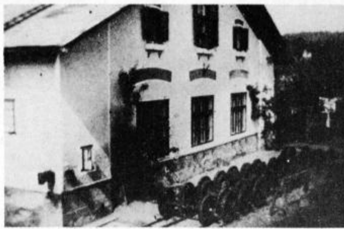
Železniške delavnice v Ptujju v času ustanovitve komunistične celice

nega voditelja revolucionarnega delavsko-kmečkega gibanja v bivšem ptujskem okraju med obema vojnoma. Izreden je bil njegov vpliv na delavstvo