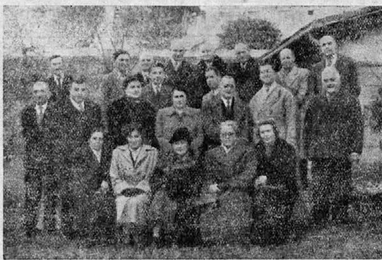
KANDIDATI »LIPOVE VEJICE«

Goričani, VOLITE LIPO, ker boste s tem volili: slovensko krščansko demokratično