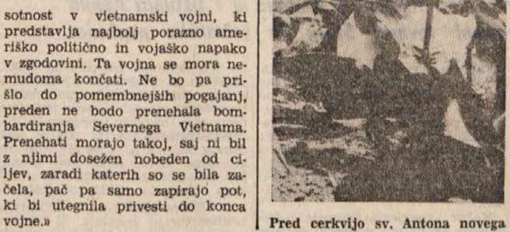
Pred cerkvijo sv. Antona novega

OVEN (od 21. 3. do 20. 4.) Ne odlašajte, marveč čimprej opravite nalogo, ki ste jo sprejeli. Vidite napredek na čustvenem potoku. BIK (od 21. 4. do 20. 5.) Zgodnje jutranje ure so najbolj prijetne za dosego vašega cilja. Ne napajate osebi, ki se vam priljubijo. DVOKLA (od 21. 5. do 21. 6.) Predstavniki z vašim delom niso najbolj zadovoljni. Prišlo bo do porazov med vami in drago osebo. RAK (od 22. 6. do 22. 7.) Odkrili boste osebo s finančnimi sredstvi, ki so vam potrebna. Otrsite se svoje vrasvetnosti. LEV (od 23. 7. do 22. 8.) Naj ne omami sijaj neke ponudbe, ki se vam vrti. Nepremišljeno se