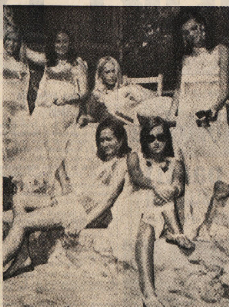
Blizu Porta Santo Stefano je nočni lokal »Le Streghe«, kjer gostje sredi šest angleških natakarc. Gostje, vsi navdušeni nad predstavo in predvsem lepoto natakarc, jih po lokalu imenujejo »le streghette«.

Najbolj zanimivo je to, da so v Washingtonu precej mimo sprejeli to novico. Predstavniki State Departmenta so v neuradnih pogovorih dejali, da oporišče v Pešavaru tako in tako ni več potrebno, ker znajo vohunski sodeljci prav tako dobro opraviti svoje naloge. In tako kaže, da so vsi več ali manj zadovoljni, razen Indije, ki se je ob najnovejši sovjetski odločitvi morala spriznati z nekaterimi dejstvi in realnostmi v mednarodnih odnosih.