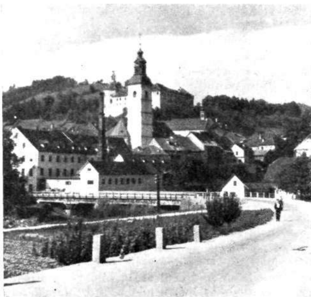
Ze celotna zunanost Škofje Loke daje lepo sliko

Prehodnost. Tod sta vhoda iz Ljubljanske kotline v Selško in Poljansko dolino. Skozi Selško dolino gre cesta čez Petrovo brdo (804 m) v Baško grapo in v Soško dolino pri Mostu na Soči. Po Poljanski dolini so cestne zveze skozi Hotavljce ali Fužine s Cerknim, skozi Žiri in čez Rázpotje (704 m) z Idrijo. Železniška postaja na gorenjski progi je 3 km iz mesta na Sorškem polju pri vasi Trata. Cesta s postaje do mesta in Stare Loke je asfaltirana. Na postajo in po obeh dolinah obratujejo redne avtobusne proge.