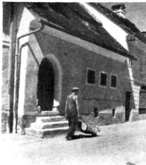
Tudi skromna Grohčeva hiša na Lontrgu je znamenita, ker kaže značilne arhitektonske elemente iz prejšnjih stoletij