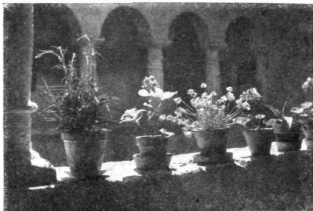
Arkade na dvoriščni strani starega rotovža

Mestni trg h. št. 34 — pri Fidelčku, potem Klobovsova hiša: Obokana veža, v veži kovana železna vrata, arkadni hodniki, lokal v pritličju predelan leta 1955 za tovarno »Šešir«. V prejšnjih časih je bila tod štacuna stare vrste, podobno kakor v bivši Kernovi hiši (gl.: Cankarjev trg!).