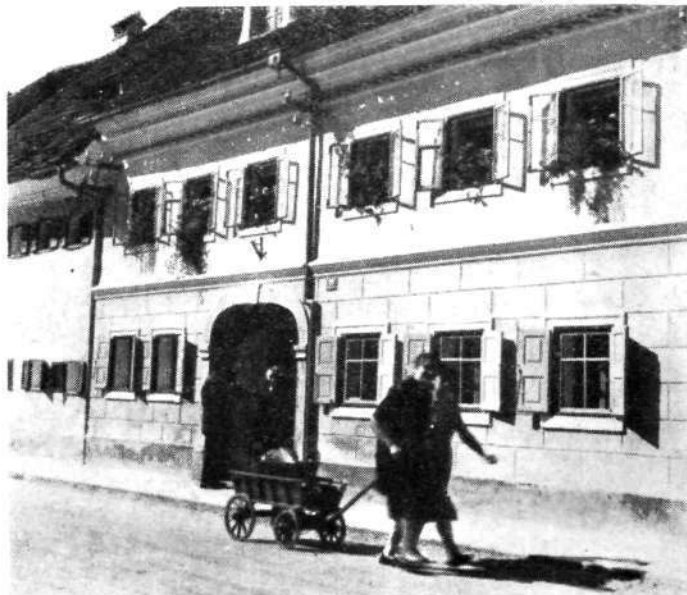
Pri Brojenčku na Lontrgu krasijo olepšano in lepo pobarvano pročelje še rože na oknih