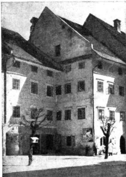
Del Mestnega trga, ki še spominja na cehovske čase

Mestni trg h. št. 7 — pri Kašmanu: Združena iz dveh hiš, zaradi česar ima še dvojne dvorišče. Lepo prirejeno novo skupno pročelje povzdiguje Mestni trg. Na južnem dvorišču ohranjene arkade na eni strani. Zadaž izhod na vrt skozi gotski portal.