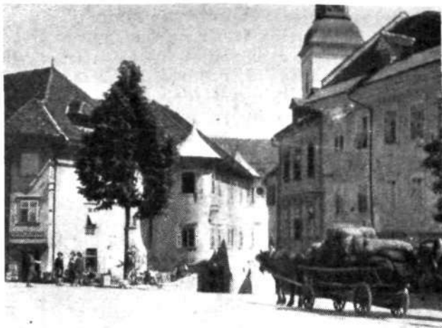
Mestni trg s prehodom proti cerkvi, na levo Homanova, na desno Kajbetova hiša

obzidja je bil prostor dragocen, zato so mestne hiše stisnjene in visoke, ulice, razen Mestnega trga, zelo ozke, ponekod speljane pod oboki skozi hiše. Zvečer so vrata zapirali. Ponoči je nočni čuvaj s helebardo v roki varoval mestne hiše pred tatovi in požarom. Zunaj obzidja so bila predmestja: Karlovec, Trata, Studenec in Kapucinsko predmestje. Ob zidu je bil jarek. Na južni strani so pozneje ta jarek zasuli, ohranilo pa se je ime Graben. V 18. stoletju so vključili v obzidani del