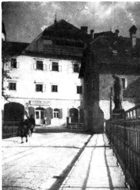
Pogled s kamnitega mostu skozi obok v Blaževo ulico, na desni Bogatajeva (prej Feškova) hiša med predelavo

Leta 1552 je ustanovil kamniški župnik Otokar samostan klaris v Loki in mu prepustil 37 kmetij v raznih krajih med Kamnikom in Loko. Prva prednica je bila ustanovnikova sestra, krčmarjeva žena, ki je šla s hčerjo vred v samostan. Stari del samostana, ki ima sedaj zunaj na zidu vzdan lep kamniti relief križanja iz leta 1550, je bil dograjen leta 1558. Cerkev so sezidali l. 1593. Samostan je množil svoje bogastvo s kmetijami, ki jih je dobival v fevd in z dediščino nun iz bogatih rodbin. Luteranstvo je poseglo tudi med klarise in od 52 nun so ostale samo 4. Potem, ko je l. 1660 požar razdejal stavbe, so jih obnovili in l. 1669 dokončali sedanjo baročno cerkev, ki pa razen nagrobnikov samostanskih dobrotnikov nima posebnih znamenitosti. L. 1782 je bil red klaris s cesarskim ukazom razpuščen, ker ni bil času primeren. Imetja je bilo ta-