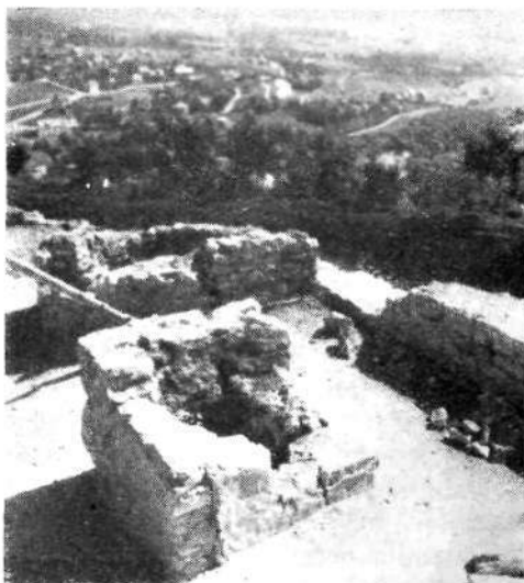
Pogled z razvalin Zgornjega stolpa na zraven stoječi ostanek peči in zunanji zid

Tik pod Krancljem se ovija stari del Loke in raste z novimi deli predmestij vedno bolj proti železnici. Z mestom se povezujejo vasi, ki so tudi že zelo stare. Stara Loka je obstojala — kakor že ime kaže — še pred nastankom freisinškega gospostva. To je bilo čisto slovensko naselje, prav tako kot Reteče in Gosteče niže doli ob Sori. Večino okoliških vasi so pa ustanovili šele poznejši nemški naselniki. Večji del ozemlja, ki ga je dobil škof, je bil namreč pod gozdom in takrat nedonosen. Da bi povečali svoje dohodke, so dali škofje svojo pokrajino naseliti. Naselniki so gozd trebili, obdelovali pridobljena zemljišča in škofu plačevali dajatve. Na ravnino so prišli Bavarci. Tako so nastali Binkelj, Vešter, Moškrin. Crngrob, ki jih vidimo v ozadju