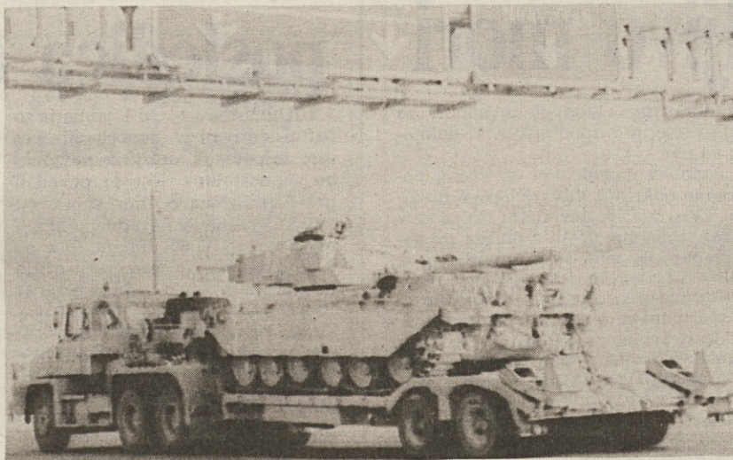
Britanski tank vrste challenger v savdski puščavi: v zadnjih dneh so britansko oklopno enoto premaknili za 100 km bližje kuvajtski meji