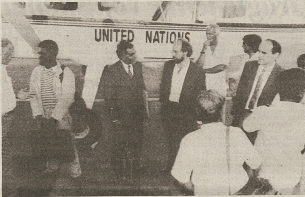
Iz Mogadiša so nekateri člani Mednarodnega rdečega križa že odpotovali v Nairobi

Ne samo, da je včeraj predlagal premirje, njegovi najožji svojci so baje že zapustili Mogadiš in se zatekli v tujino. Kako se bo zadeva razvila, ni jasno niti najboljšim poznavalcem somalskih razmer, ker tu ne gre samo za ideološki spor. Za razliko od drugih afriških držav, kjer se diktatorji oslanjajo na neko pleme, v Somaliji imamo klane, med katerimi so zavezništva dosti bolj labilna.