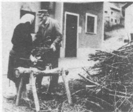
Letošnja mila zima je prišla nekaterim kot nalašč za spravljanje drv

Skrbni vaški kronisti vedo povedati, da ima Podolnica ta hip le še devet pristnih kmetov, šest obrtnikov (ostali si služijo kruh bodisi v Ljubljani bodisi v Horjulu) in vsega štiri telefone (pa še te premorejo le obrtniki). Zdaj si že nekaj časa