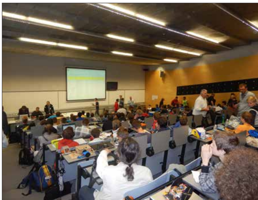
Slika 2. Tekmovanje ROBOSled DIRKAČ v predavalnici G2-ALFA

RoboCupJunior je sestavni del svetovnega robotskega tekmovanja za osnovnošolce in srednješolce. Tekmovanje RoboCupJunior ima tri