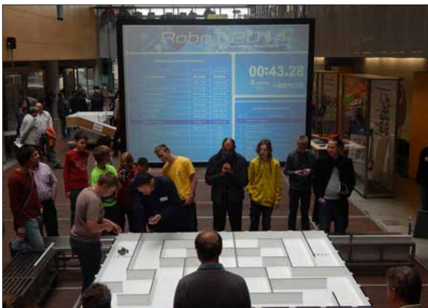
Slika 1. Dijak tekmovalac in gledalci ob labirintu

To je tudi najstarejše slovensko robotsko tekmovanje, ki se ga je v petnajstih letih udeležilo že okrog 100 študentov ter nad 400 dijakov in mentorjev iz Slovenije, sosednje Hrvaške in Avstrije.