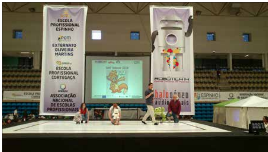
Slika 4. Plesni nastop srednješolske slovensko-avstrijske ekipe SIAT Tedusar 2014 na tekmovanju RoboCupJunior na Portugalskem

Odrprtega državnega tekmovanja RoboCupJunior Reševanje A za OŠ 2014 se je udeležilo 35 osnovnošolskih ekip (107 tekmovalcev), odrprtega državnega tekmovanja RoboCupJunior Reševanje A za SŠ se je prav tako udeležilo 35 srednješolskih ekip (111 tekmovalcev).