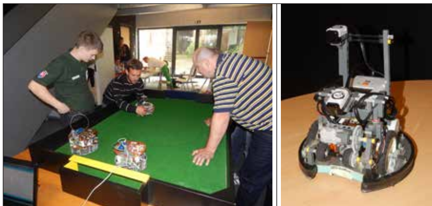
Slika 5. Posvet pred tekmo v robotskem nogometu (levo), eden od robotov za igranje nogometa slovaške ekipe XLC (desno)

ekipa SIAT Tedusar 2014, ki je v okviru projekta SI-AT TEDUSAR v letu 2014 sodelovala še na avstrijskem državnem tekmovanju RoboCupJunior na Dunaju in na portugalskem državnem tekmovanju RoboCupJunior v Espinhu. Slovensko-avstrijsko ekipo SIAT Tedusar 2014 sestavljajo 4 slovenski člani iz ŠC Ptuj, Elektro in računalniška šola, ter 4 avstrijski člani iz srednje šole HTBLA Weiz.