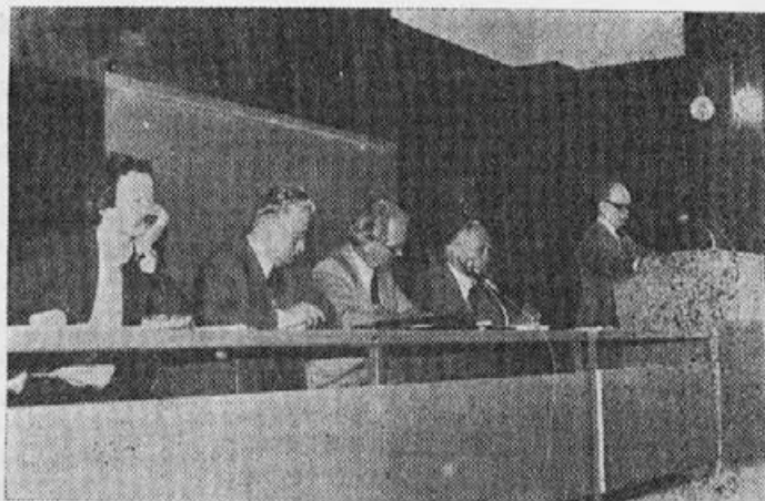
Predsedstvo med skupščino

Poleg Medexa in Čebelarke zadruge se danes pojavljajo tudi druge organizacije, med njimi predvsem združne organizacije, ki dajejo čebelarjem več. Ne gre več samo za odkup medu in oskrbo z repromaterialom, gre tudi za dohodkovne odnose in premiranje in regresiranje. Na podlagi izkušenj v kmetijstvu — čebelarstvo je sestavni del kmetijstva — ustrezno obravnavajo tudi čebelarstvo, npr. ZKZ Mozirje.