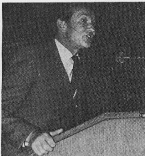
Predstavnik Kmetijskega inštituta Slovenije je seznanil delegate s pripravami za ustanovitev čebelarkega oddelka na inštitutu

legati so poudarili tudi, da se ekonomski položaj čebelarjev poslabšuje zaradi izredno hitrega naraščanja cen repromateriala in drugih stroškov. Menili so, da je razlika med odkupno in maloprodajno ceno medu in drugih čebeljih pridelkov pretirano velika in to seveda na škodo čebelarja. Tudi varoza namreč znatno vpliva na slabšanje ekonomskega položaja čebe-