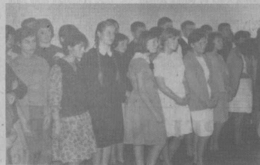
Čez štiri leta bodo zapeli: »Veseli mo se torej, ...«