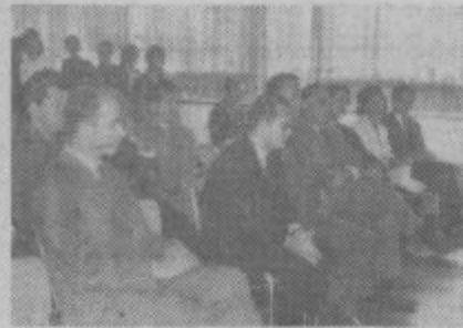
Predstavniki družbeno politične skupnosti na otvoritvi

Skokovit gospodarski napredek velenjske občine in bogastvo premoga, ki se v temačnih globinah ponuja rudarjem rokam, obeta v prihodnosti še večji gospodarski napredek in povečanje prebivalcev. Zato se nenehno veča tudi število šolobveznih otrok, saj jih je bilo preteklo šolsko leto več kot 4.000.