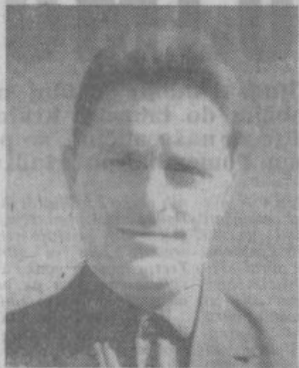
»Upoštevali bomo rotacijo...«

Težko je določno predvidevati kaj vse bodo na konferencah obravnavali, ker smo jih sklicali tudi zaradi tega, da bomo lahko občinsko konferenco čim bolj posvetili perečim problemom našega območja. Vsekakor bodo dosti govorili o problemih komunalnega značaja, delu krajevnih skupnosti, zlasti kako bodo z lastno udeležbo izpolnili njihove programe. Opazili smo, da so nerazrešene stvari okoli kmetijske kooperacije in odnosa kmetijske zadrage do individualnih kmetijskih proizvajalcev. O tem vprašanju so na nedavnih sestankih že večje opozorili. Temeljito pa bodo na izrednih konferencah spregovorili tudi o ostalih družbeno političnih problemih, ki se lahko rešujejo v okviru naše organizacije kot najvišje tribune delovnih ljudi.