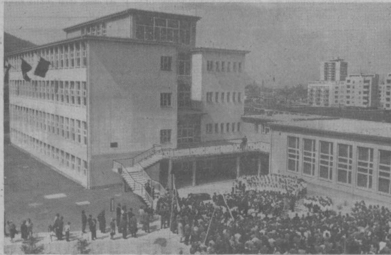
Osnovna šola »Gustava Siliha« v Velenju je delo kolektiva »VEGRAD«