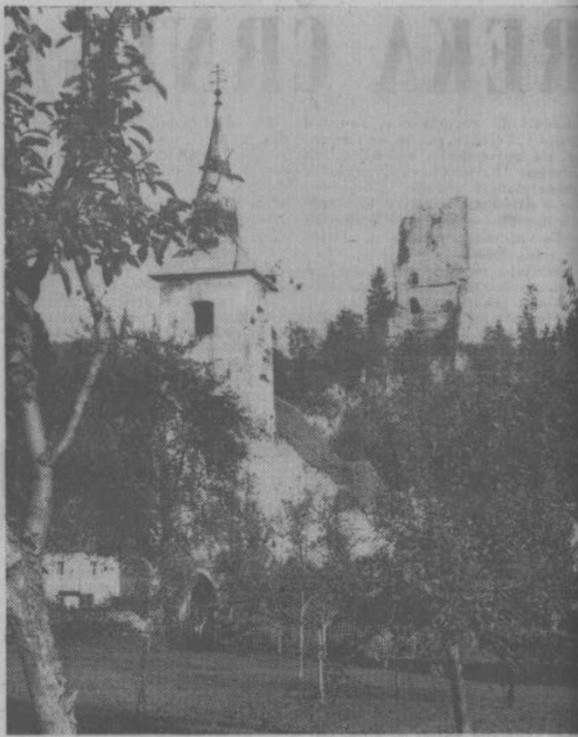
Preteklo nedeljo so v Saleku odprli vodovod, ki so ga prebivalci s prostovoljnimi delom napeljali od glavnega voda. S tem so prispevali svoj delež k proslavljanju.

In kako bo z delitvijo ustvarjenih sredstev? Podrobna analiza kaže, da bodo v prihodnjem letu vložili večino ustvarjenih sredstev v obrat za predelavo tufa in v apnenico. S to rekonstrukcijo bodo proizvodnjo tufa in apna povečali za enkrat, obenem pa bodo pocenili proizvodnjo. Tako si prizadeva kolektiv komunalno obrtnega centra OLJKA v Smartnem ob Paki, da sodobnejše opremi svoje obrate, poceni proizvodnjo kot ceno uslug in to s smiselnim vlaganjem lastnih sredstev, s stalnim izpopolnjevanjem organizacije dela in jasno z vse večjim porastom storilnosti ter večjimi osebnimi dohodki zaposlenih.