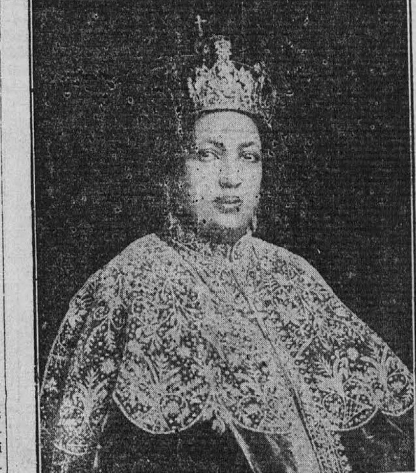
Abesinska kraljica Menen, soproga kralja Selassie, v svojem kraljevskem ornatu. Kraljica se je izrazila, da bo v slučaju vojne z Italijo tudi ona sama vodila svoje čete na fronto.

Najzanimivejše vesti so v Amer. Slovencu; čitajte ga!