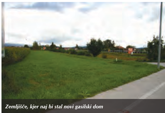
Zemljišče, kjer naj bi stal novi gasilski dom

Napoved gradnje novega gasilskega doma je bila omenjena v večini predvolilnih oglasov in drugih napovedi kandidatov za župana in za stolčke v občinskem svetu. Ker je bilo kar preveč »meglenih obljub«, naj povemo, da je Občina pred časom že pridobila zemljišče, na katerem bodo dom zgradili. Gre za zemljišče ob križišču Mengeške in glavne ceste, ki povezuje Domžale in Ljubljano. Izbrano mesto je za gasilski dom skoraj na idealnem mestu, saj je nekako sredi Trzina, približno enako oddaljeno od zgornjega in spodnjega dela Trzina. Gasilci bodo imeli lažje izvoze in po glavni cesti bodo lahko tudi sorazmerno hitro prišli do morebitnih pomoči potrebnih v OIC Trzin. Občina bo zdaj začela s postopkom sprejemanja potrebnega podrobnega prostorskega načrta za ureditev območja, nato pa bodo začeli pripravljati še drugo projektno dokumentacijo. Hkrati z gasilci naj bi v novem domu svoje prostore dobila tudi civilna zaščita. Vse skupaj bi lahko v idealnih razmerah zaključili v enem letu. Upamo, da bo novemu vodstvu Občine to zares tudi uspelo.