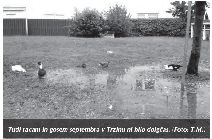
Tudi racam in gosem septembra v Trzinu ni bilo dolgčas.

Ko berete te vrstice, je znan tudi že novi trzinski župan, saj smo tudi trzinski volivci tekli drugi krog. Kaj vse se je dogajalo s kandidati za župana in občinske svetnike, ni vredno omenjati, a zdi se, da tokrat ni bilo kakšnih zelo nizkih udarcev. Tudi kampanje posameznih kandidatov so bile nekoliko drugačne, sodobnejše. Nekateri so celo delili seme v majhnih stekleničkah, ki pa, sodeč po rezultatih, ni vzkliklo. Kar je zelo zaskrbljujoče, je, da Trzinci kljub dejstvu, da smo ena najbolj izobraženih občin v državi, nimamo nadpovprečno izobraženih kandidatov. Smo res že tako daleč, da se v imenu »demokracije« odpovedujemo tudi lastnemu prispevku za našo državo? Morda se boste pa zdaj, ko so vse letošnje volitve in referendumi mimo, vprašali, kaj lahko naredite za državo, če že ona ne more (skoraj nič več ...) za vas.