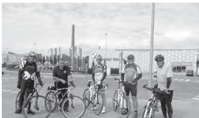
Pešadijski častniki so včasih hodili peš, a kaj moremo – časi se spreminjajo.

Člani Območnega združenja slovenskih častnikov Domžale smo si za druženje in nabiranje vzdržljivosti omislili kolesarjenje. Za začetek nas ni bilo veliko, verjamemo pa, da nas bo že naslednjič bistveno več.