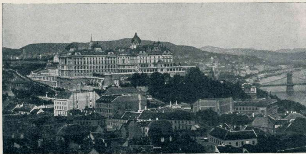
KRALJEVI GRAD V BUDIMPEŠTI