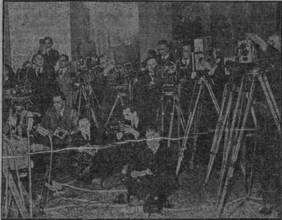
Berlinski fotografi se pripravljajo, da fotografirajo Hitlerjevo vlado.

Marija Snežna. Da bo naše Prosvetno društvo v teh zimskih mesecih poživilo svoje delovanje, zato vprizori v nedeljo dne 12. t. m. popoldne ob treh kar zaporedoma dve veseligrigi s petjem in sicer: »Kaznovana nečimernost« ter »Dr. Vsezna! in njegov sluga Štipko