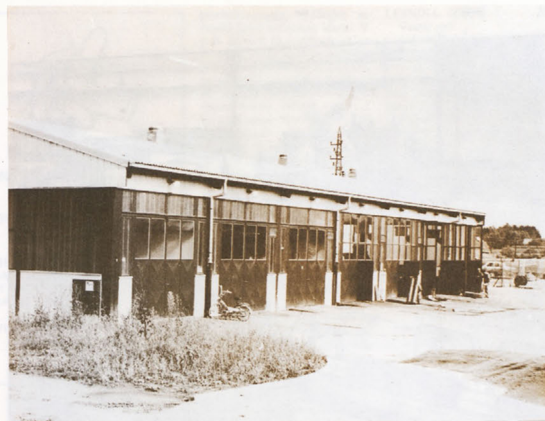
Pogled na južni del nove hale TOZD TES

da zadnja V. seja OK ZSMS Novo mesto ni uspela predvsem zaradi nepripravljenosti, tako v organizacijskem kot v vsebinskem smislu. Želja vseh mladincev je, da s svojim delom prispevamo k delovanju mladinske organizacije v TOZD, v DO in v občini.