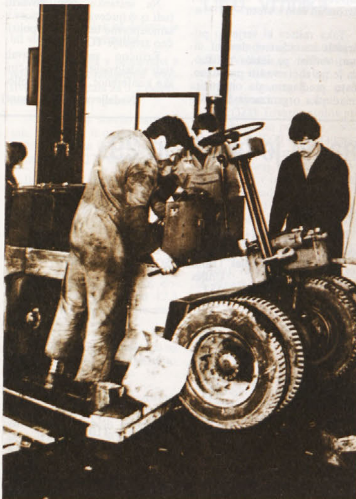
TOZD TES – popravilo viličarja