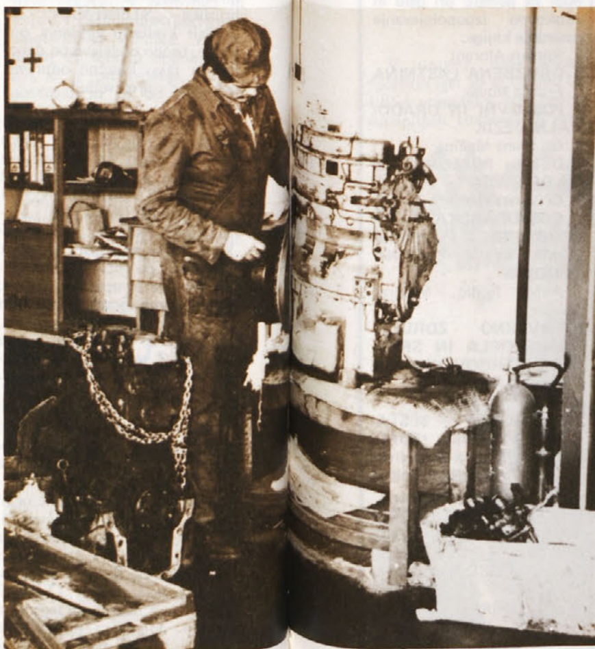
TOZD TES – popravilo motorja