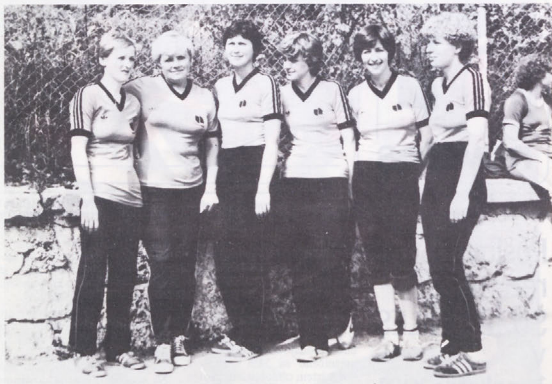
Del predstavnic Novolesa na 1. športnih iger delavcev SOZD Uniles

V povzetku lahko ugotovimo, da je bilo pri poslovanju združenih delovnih organizacij in s tem tudi v SOZD Uniles kot celoti, prisotno stabilizacijsko obnašanje in da so doseženi rezultati sorazmerno še vedno ugodni, razporeditev dohodka pa v skladu z družbeno usmeritvijo.