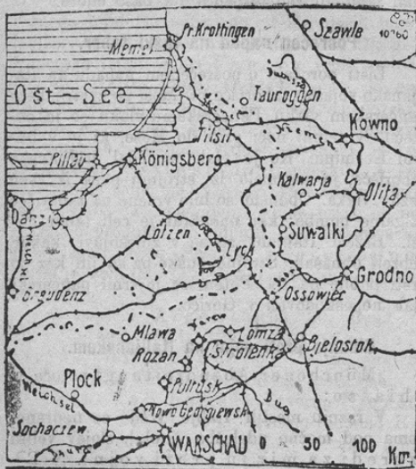
Die Narew-Njemen Front.

V boljše razumevanje uradnih vojnih poro-