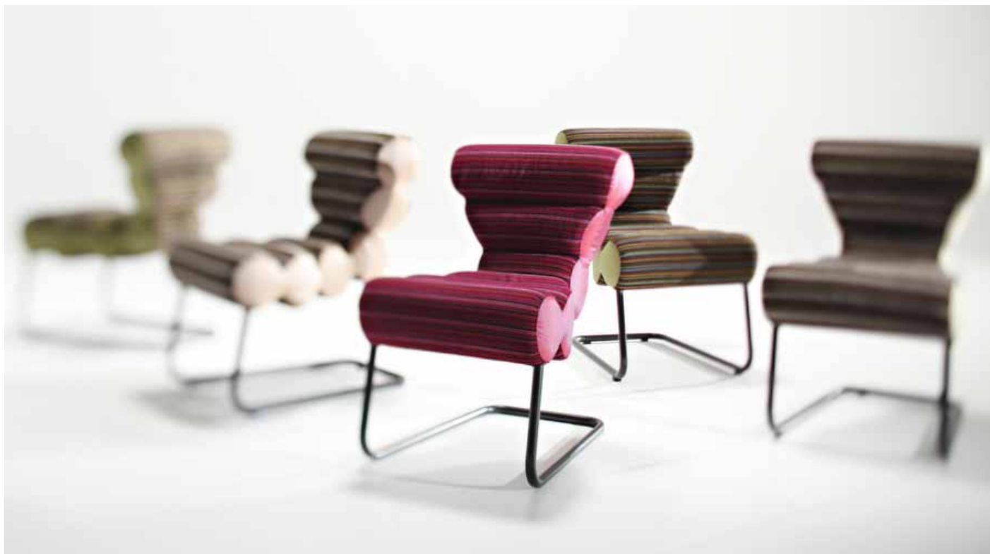
Slika 4: Fotografija prototipa.