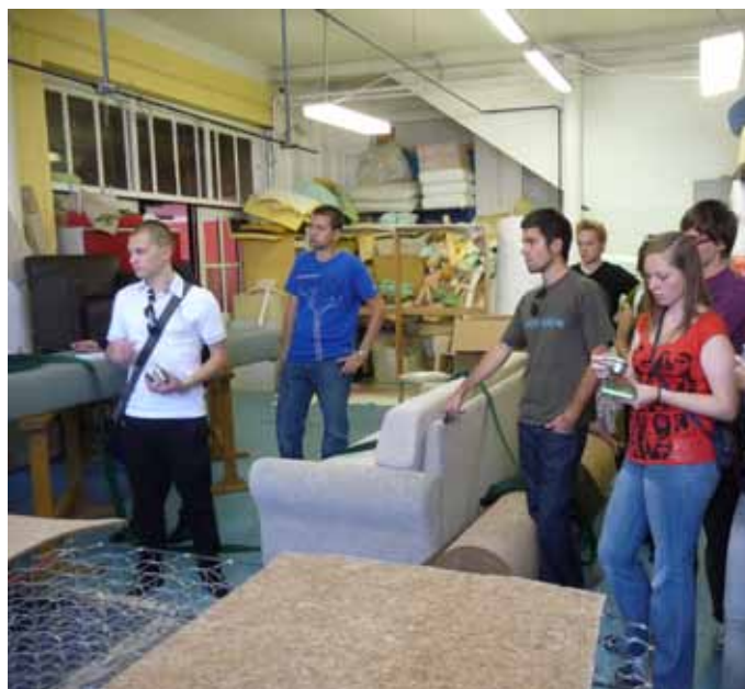
Slika 2: Obisk tapetniške delavnice Klun Ambienti d.o.o..