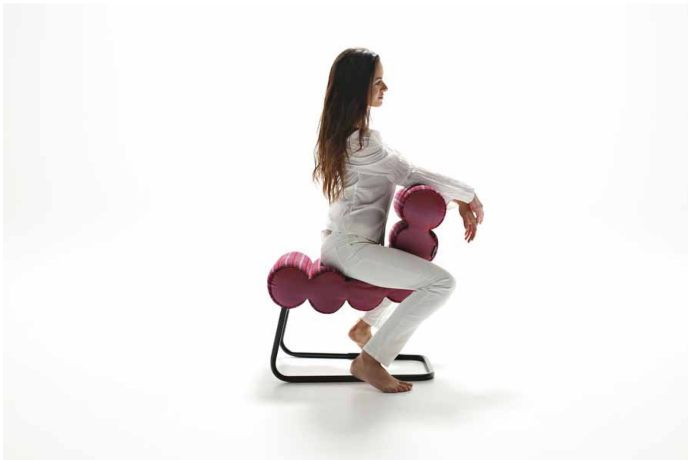
Slika 3: Fotografija prototipa.