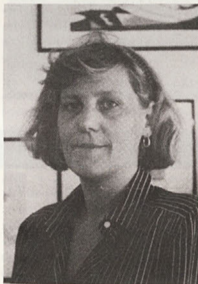
za senat v Trstu okrožje 2