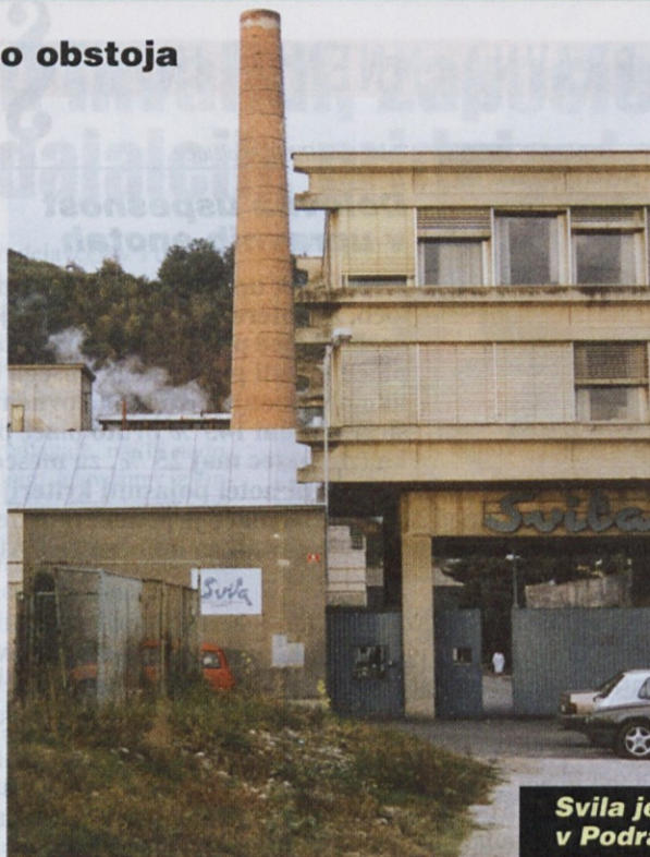
Svila je ena redkih tekstilnih tovarn v Podravju, ki posluje uspešno

Ob ustanovitvi je Svila proizvedla letno milijon metrov tkanin. Proizvodnja se je po-