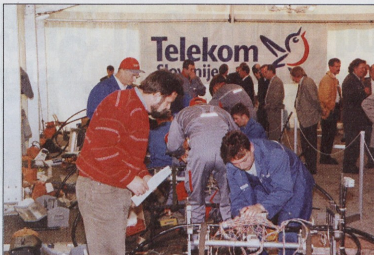
Budno oko tekmovalne komisije je pazilo, da je tekma potekala po pravilih.

Pri Poštarskem domu na Pohorju je pred dnevi potekalo 6. državno prvenstvo telekomunikacijskih kablinskih monterjev, ki ga organizatorji vsako leto posvetijo spominu prezgodaj umrlega Vladimirja Lokarja, priznanega vrhunskega strokovnjaka s področja telekomunikacij in kablinske tehnike. Na tekmovanju se je zbralo 17 ekip iz vse Slovenije, ki so se pomerile v teoretičnem znanju in praktični usposobljenosti.