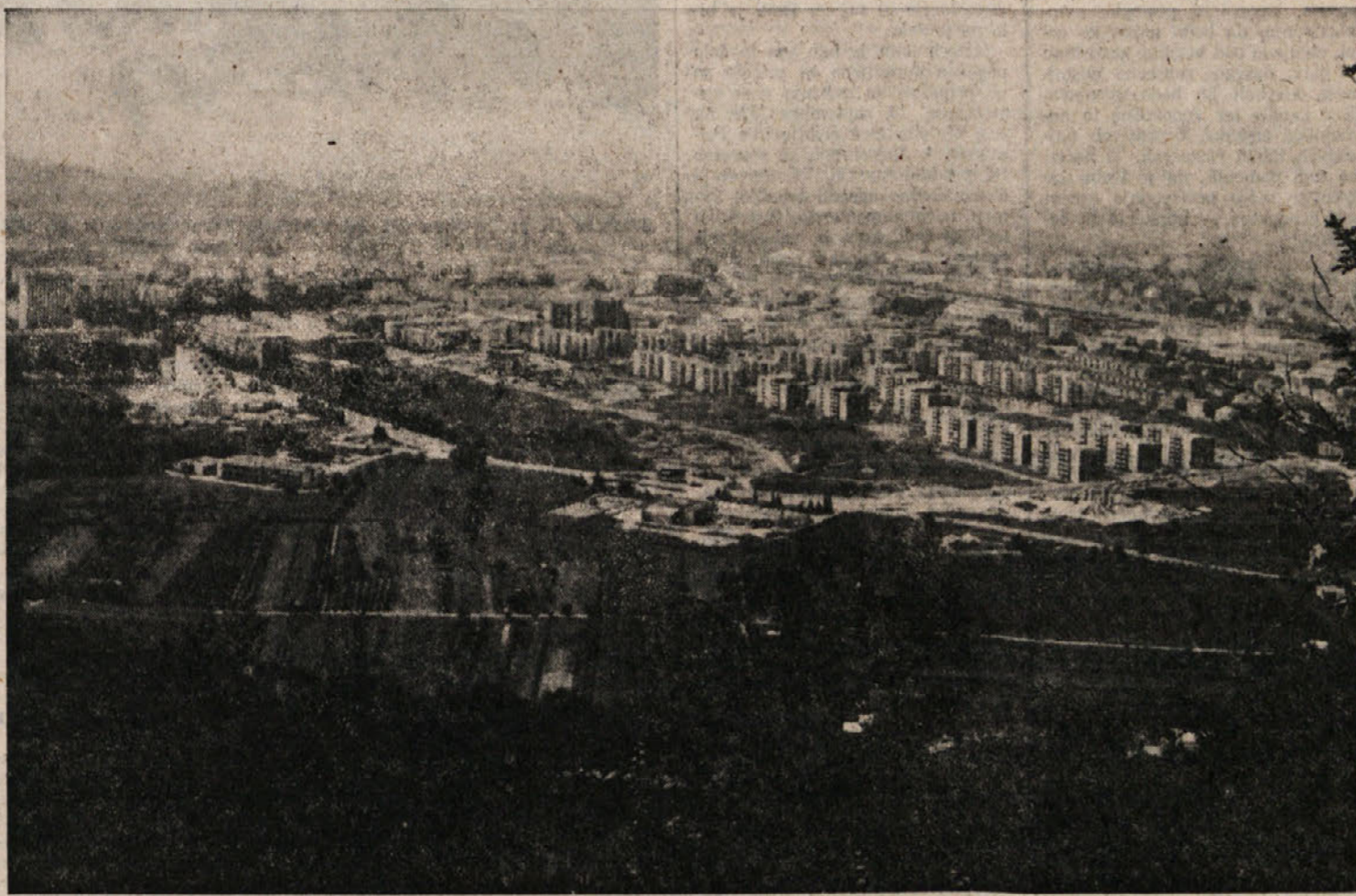
Pogled na Novo Gorico s Kekca. V ospredju novo stanovanjsko naselje na Ledinah

Po izjavah Cestne skupnosti Slovenije, nam je dejal predsednik Šušmelj, se prične še letos graditi obmejno postajališče. Z deli bodo pospešeno nadaljevali v letu 1978 in predvideno je, da tam do leta 1980 zgradijo povezavo tega postajališča tudi prva deset kilometra avtoceste s priključkom na novo cestno povezavo med Sempetrom in Rožno dolino. Nova cesta naj bi obšla Sempeter, ki bi se tako rešil dogajanja prometa, ki ob konicah občinskega blokira za manjše potrebe urejeno središče tega kraja skozi tunel in po nadvozi, ki bi povezovala z obstoječo cesto, ki veže Novo Gorico s tunelom med Panovcem z Rožno dolino. Vsa ta dela naj bi bila končana do leta 1980 in tako bi se ta večina mednarodnega prometa odvijala po novem mejnem prehodu. Seveda pa ostaja odprto vprašanje modernizacije cestne