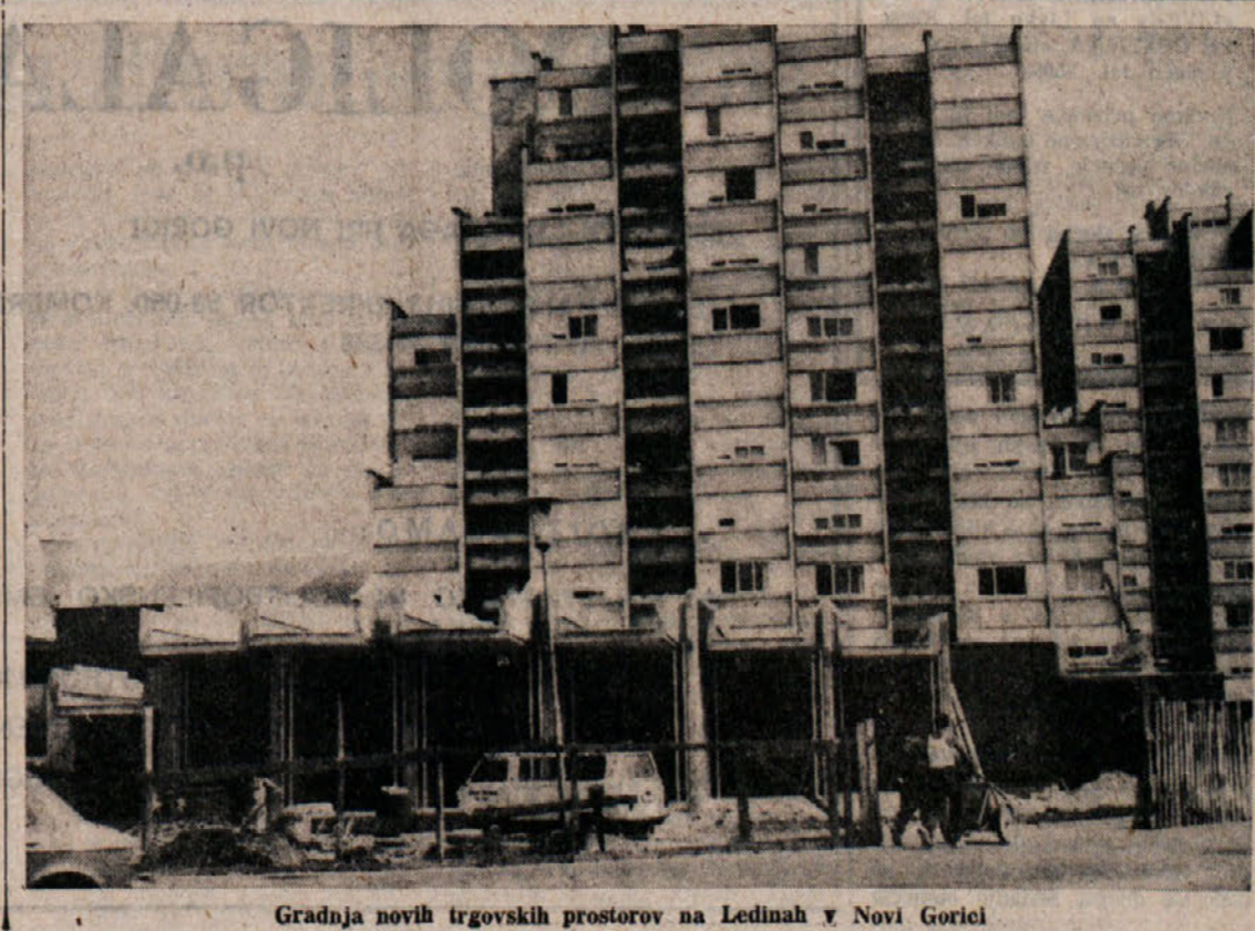
Gradnja novih trgovskih prostorov na Ledinah v Novi Gorici

delo na elektrarni Solkan - Pripravljajo gradnjo 380 kV daljnovođa med Jugoslavijo in Italijo