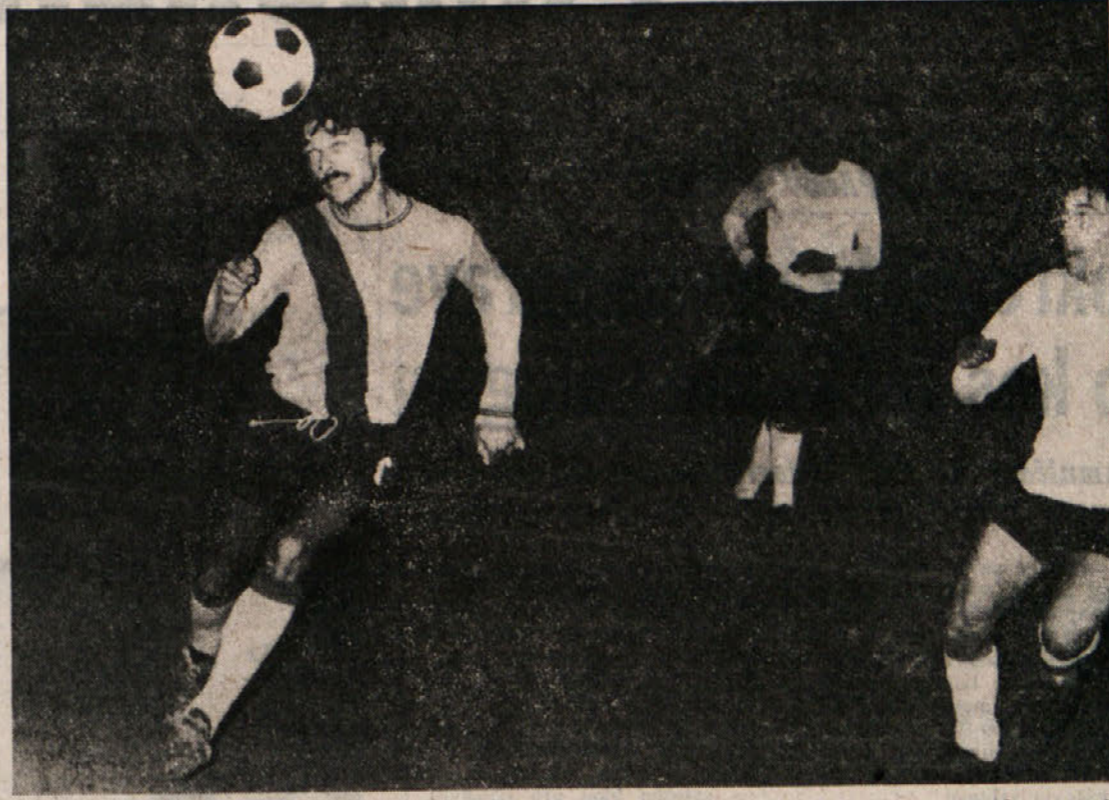
Primorceva nogometna enajsterica bo danes in jutri zelo zaposlena, saj bi morala nastopiti kar na treh tekmah...