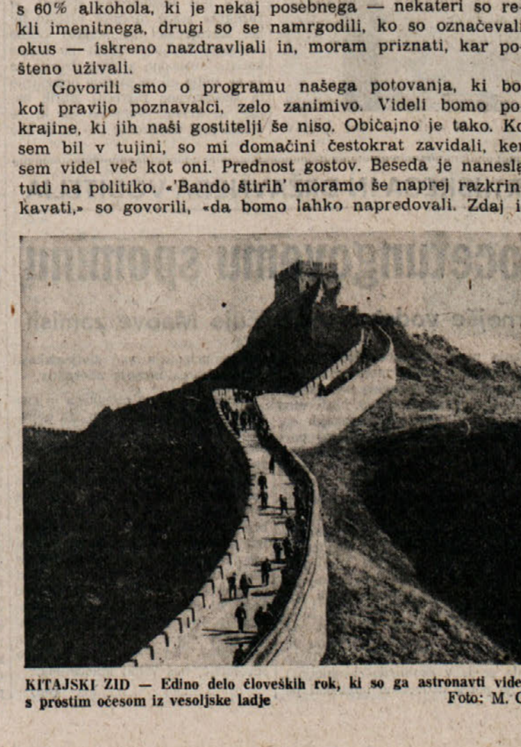
KITAJSKI ZID - Edno delo človeških rok, ki so ga astronomi videli s prostim očesom iz vesoljske ladje.

mamo štiri naloge. Poleg razkrinkavanja bande moramo obnoviti partijo, povezati ljudstvo z njo, modernizirati proizvodnjo. Banda je govorila, da ni potrebno nagrajevanje po delu. To je nesmisel.