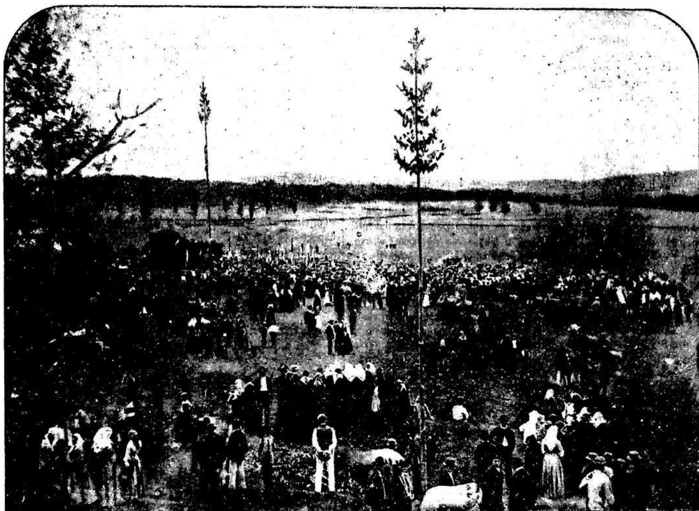
Slika s tabora.