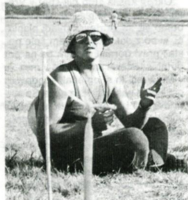
Čakanje na pravi trenutek za izstrelitev

delovnih organizacij, potrebne pa je mnogo lastnega denarja, saj se samo na ta način člani kluba lahko udeležujejo tekmovanj. Toda o tem in še drugih problemih kluba kdaj drugi.