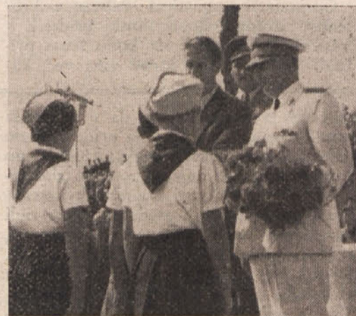
Goriški pionirji izročajo maršalu cvetje

Na rezervirani prostor pred slavnostno tribuno je druga za drugo prikoralo 14 s slavo ovenčanih primorskih,