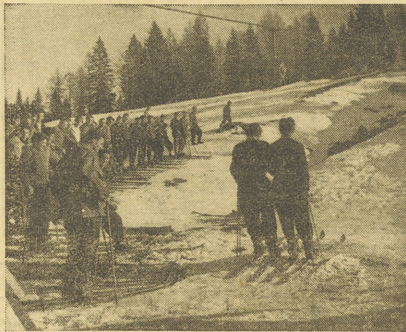
Ob žičnici na Crnem vrhu, ki je delo jeseniških fizikalnikov

Ko so jeseniški fizikalniki dosegli 26 zlatih, 17 srebrnih, 16 bronastih in 123 mladinskih fizikalnih znakov, niso držali križem rok, pač pa so šli s podvojeno silo na nadaljnje delo.