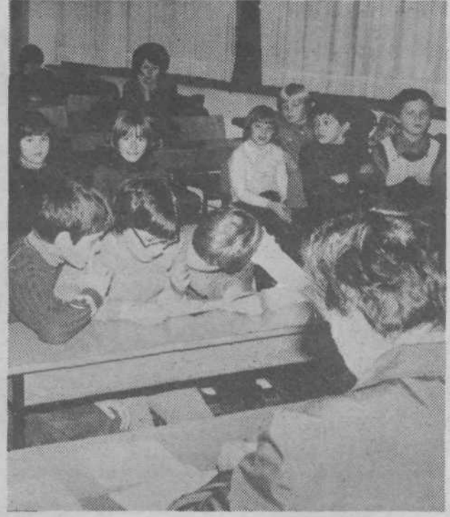
Da bi bilo novo šolsko leto čim popolnejše in čim uspešnejše