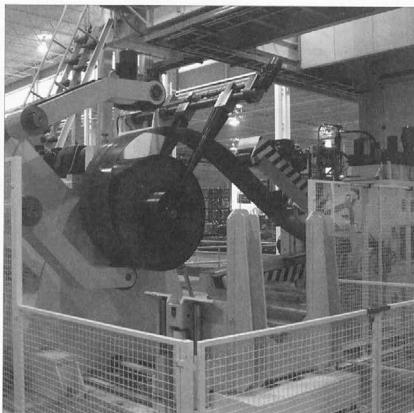
Odvijalec in ravnalec