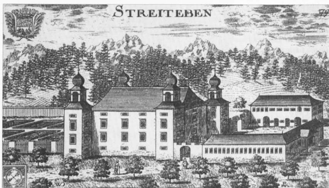
Grad Ravne (Streiteben)

V trško tkivo je vpeta kasneje izginula graščina z obstrešnimi pomoli in prizidanim stolpičem.