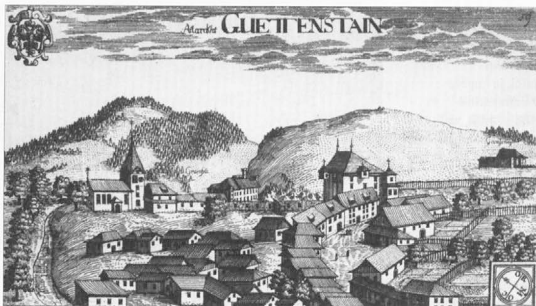
Ravne na Koroškem (Gutenstein)