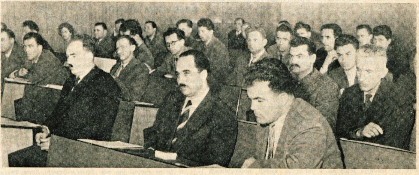
DELEGATI PLENUMA OKRAJNEGA ODBORA SZDL KRANJ MED ZASEDANJEM