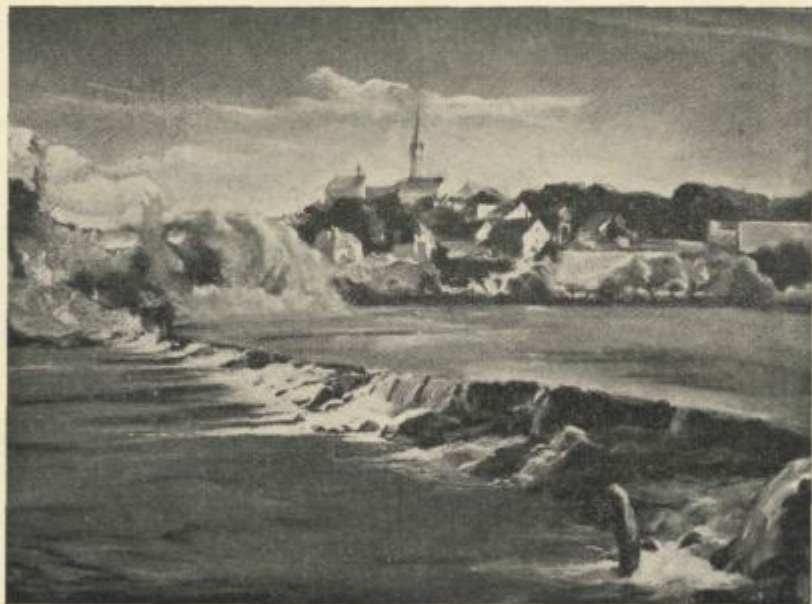
Jakac, Novo mesto

V davnih časih pa Gorjanci niso bili tako sami. V dobi turških navalov na slovensko zemljo so bili važen branik