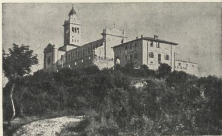
Sv. Gora pri Gorici

V a j a : Opiši kako svoje romanje ali izlet! Ali boš samo suhoparno opisal, kdaj ste šli z doma, kje ste hodili, kdaj ste se vrnili? Kaj boš tudi opisal? (Svoja čustva, doživljanje, vtise s poti, vesele dogodbice itd.)