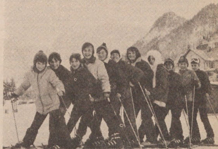
Solarji iz Brezovice na tečaju smučanja v Kranjski gori