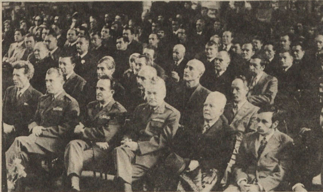
Udeleženci občinske proslave ob dnevu JLA, ki je bila v Velikih Laščah

Praznik naše JLA smo v naši občini letos kot vedno zelo slovesno praznovali in tako počastili dan ustanovitve naše armade. Niz proslav je bilo po vseh osnovnih šolah, pa tudi krajevnih organizacijah npr. Brezovici, Trnovem, Dobrovi, Polhovem Gradcu in Horjulu. Dve proslavi na terenu pa sta bili odprtega tipa, torej za vse prebivalce. Tako proslavo so pripravili v KS Malči Belič. Ob tej priliki je krajevna organizacija ZKB NOV razvila svoj prapor. Na proslavi je bila udeležba izredna, saj je mnoge pritegnila dobra organizacija.