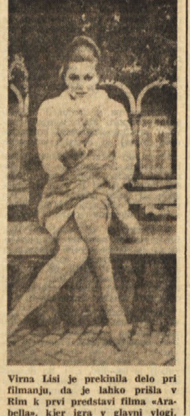
Virna Lisi je prekinila delo pri filmanju, da je lahko prišla v Rim k prvi predstavi filma «Ara- bellas», kjer igra v glavni vlogi.