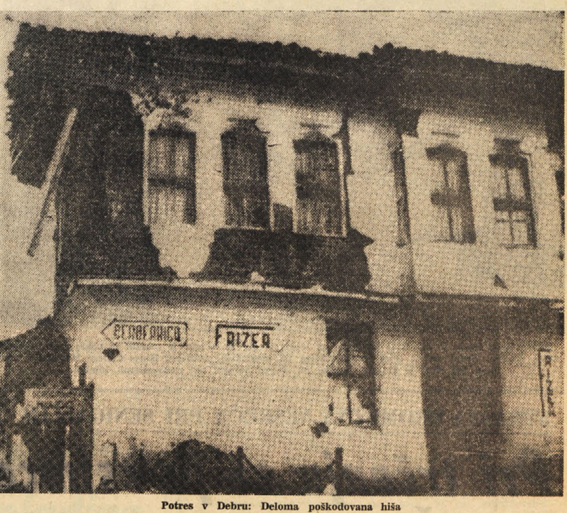
Potres v Debru: Deloma poškodovana hiša

Razsodišče 11 članov je sprejelo vse sklepe soglasno. Samo glede krivde Japonske so bili trije nasprotni glasovi.