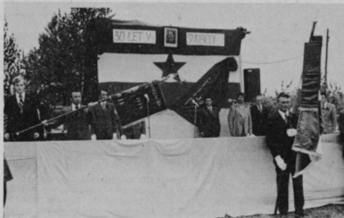
Predsednik pokrovitelja prireditve v Laporju – delovnega kolektiva IMPOL iz Slovenske Bistrice – razvija prapor Krajevne konference SZDL Laporje.

Krajevna skupnost Laporje, v naseljih in šteje skupno okrog 1700 občini Slov. Bistrica, vključuje 11 prebivalcev. Pridni ljudje živijo tod.