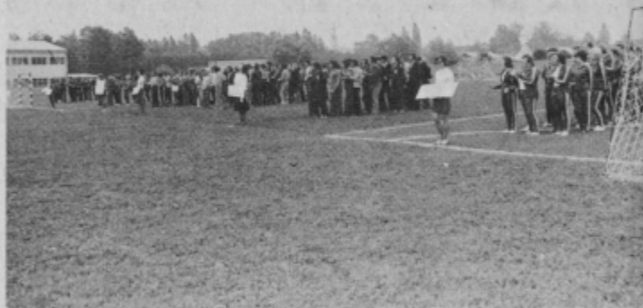
Začetek letošnjih III. iger metalurgov Slovenije.