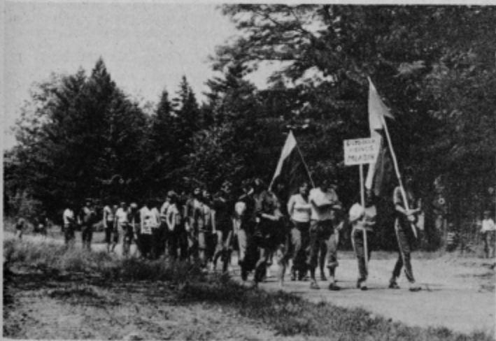
Prihod na delovno akcijo