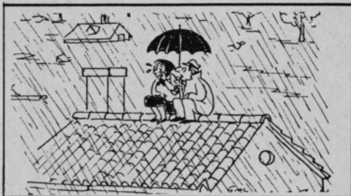
- Ne jokaj, draga, solze lahko položaj le še poslabšajo!

SREDA, 9. julija: 14.00 Poročila; 14.10 Pojo operni pevci; 14.30 Poslušalci čestitajo; 14.55 EP; 15.00 Dogodki in odmevi; 15.30 Glasbeni intermezzo; 15.45 Loto - vrtiljak; 16.45 Orkester Martin Gold; 17.00 Poročila; 17.10 Uredništvo za zborovsko glasbo; 18.00 Poročila; 18.05 Nenavadni pogovori; 18.25 Predstavljamo vam ...; 18.50 EP; 19.00 Radijski dnevnik; 19.30 Obvestila; 19.40 Ansambel Silva Štinglja; 19.50 Lahko noč, otroci! 20.00 Koncert iz našega studia; 22.00 Poročila; 22.20 Jazz; 23.00 Poročila; 23.05 Literarni nokturno; 23.15 Zabavna glasba; 24.00 Poročila.