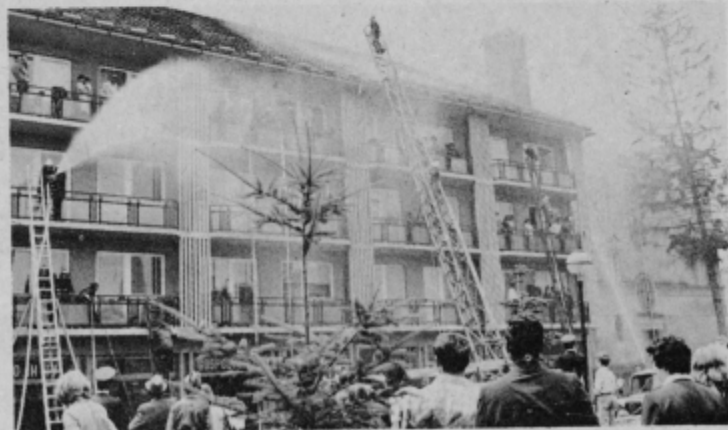
Vaja ob stanovanjsko poslovni zgradbi v Ormožu je bila res mokra...

Zlet gasilk je lepo uspel. Mogoče se bo uresničila želja, izražena na sobotnem simpoziju, da tako srečanje ne bi bilo tokrat zadnje!