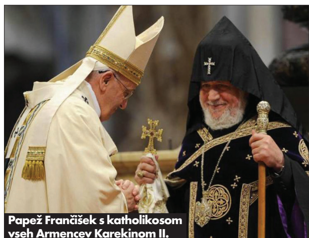
Papež Frančišek s katolikosom vseh Armencev Karekinom II.

treba poudariti in zastaviti zgodovinsko vprašanje: zakaj tega niste storili?" Papež je še pojasnil, da besede genocid nikoli ni izrekel v žaljivem duhu, temveč objektivno. Vsepravoslavni koncil je za papeža Frančiška "korak naprej". Tudi razlogi štirih Cerkev, ki se koncila niso udeležile, so stvari, ki se sčasoma lahko razrešijo. Nanašajoč se na brexit, je sveti oče zatrdil, da v Evropi že poteka vojna in da je duh ločitve že prisoten, tudi v posameznih državah. Omenil je pojava zahtev po neodvisnosti zaradi emancipacije in secesije, ki je dala izvor političnemu izrazu "balkanizacija". V ozadju so lahko kultura, način mišljenja, zgodovina, nesporazumi. Za papeža je bistveno, da je enotnost vedno nad konfliktom. Bratstvo je boljše od sovraštva ali oddaljenosti. Mostovi so boljši od zidov. Korak, ki ga mora narediti EU, da bi ponovno našla moč, ki jo je imela v začetku, je korak ustvarjalnosti in tudi "zdrave neenotnosti". To pomeni dati več samostojnosti in svobode posameznim državam. "Besede ustvarjalnost in rodovitnost sta danes ključni za EU in sta njen izziv. Za dialog danes je pomembno "moliti skupaj" in "delati za uboge, za preganjane, za mnoge ljudi, ki trpijo, za begunce".