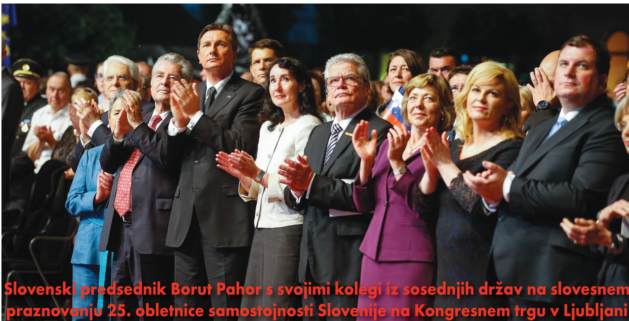
Slovenski predsednik Borut Pahor s svojimi kolegi iz sosednjih držav na slovesnem praznovanju 25. obletnice samostojnosti Slovenije na Kongresnem trgu v Ljubljani