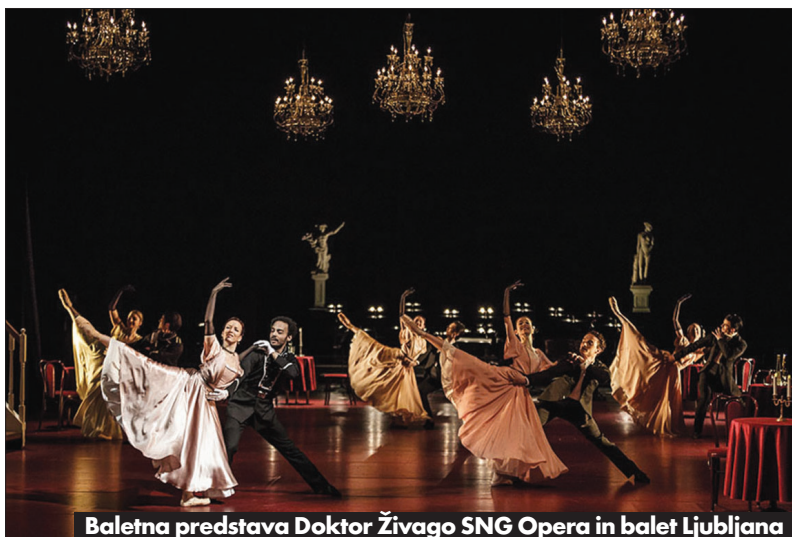
Baletna predstava Doktor Živago SNG Opera in balet Ljubljana