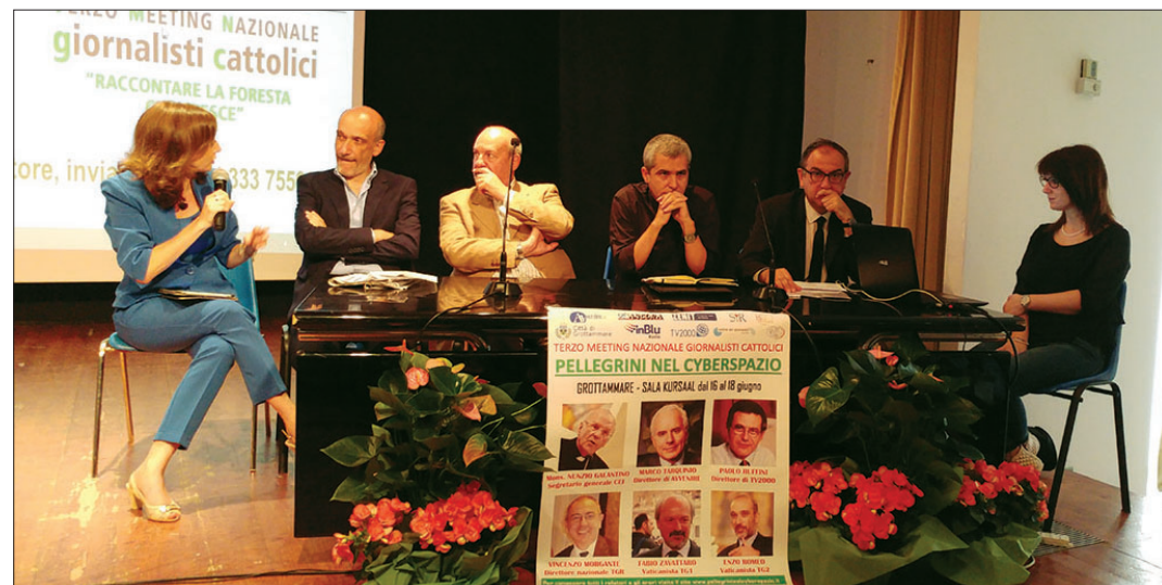
Okrogla miza vaticanistov in odg. urednika TGR Morganteja o časnikarskem poklicu danes

del Tronto se je v treh dneh zvrstilo veliko predavateljev in je bilo veliko okroglih miz, govorili so tudi o pripovedovanju zgodb in seveda o trženju, predvsem pa o vse večjih uporabah in zlorabah tako imenovanih "big data", se pravi o vseh tistih podatkih, ki jih vsi uporabniki prenosnih telefo-