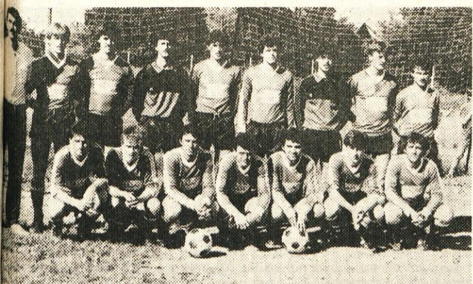
NK USNJAR — Jesen slaba, kaj prinaša poletje