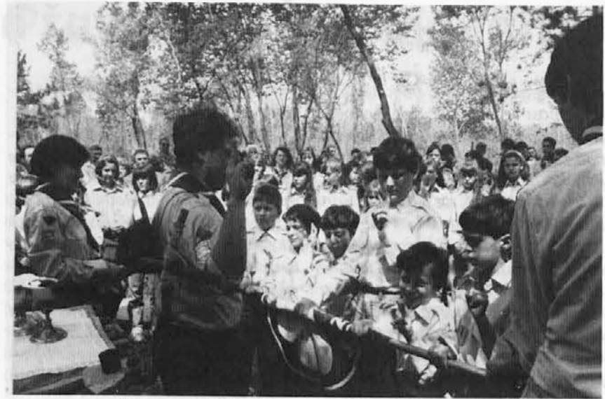
Obljube goriških skavtov na Vrhu sv. Mihaela

Šolski urad goriške nadškofije je odprt od ponedeljka do petka med 9.00 in 12.00 uro (ul. Arcivescovo do 2).