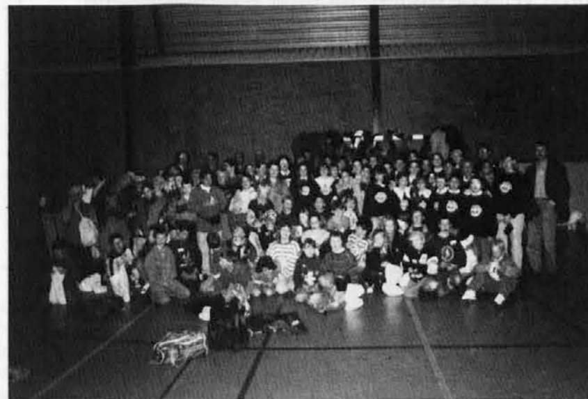
Slovenska skupina s svojimi gostitelji

Lepo vabljeni vsi, ki ljubite svoje starše!