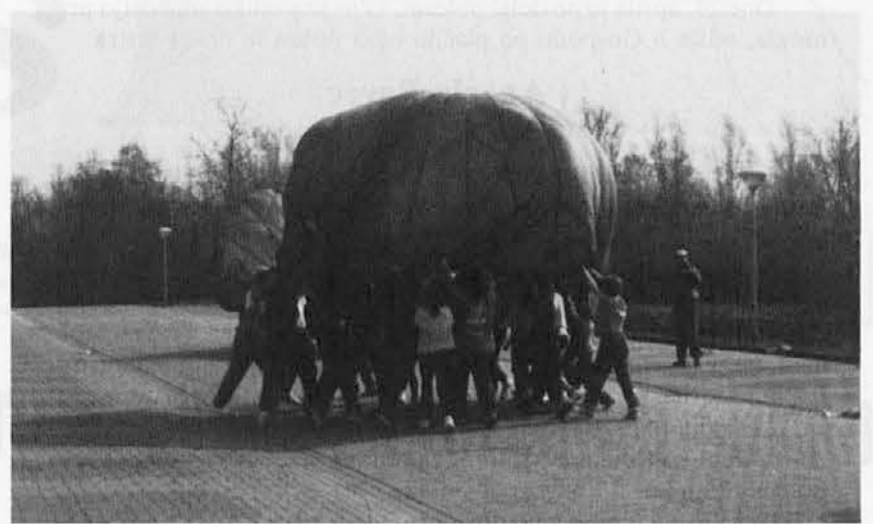
Vaje s padalom. Utrinek s športnega dne

Valentina C. meni, da je bil izlet koristen, ker: »...sem spoznala druge kraje, navade in jezik tamkajšnjih ljudi, vsaj malo sem izboljšala svojo angleščino in našla nove prijatelje. Valentini in Mitju hvala za njuno