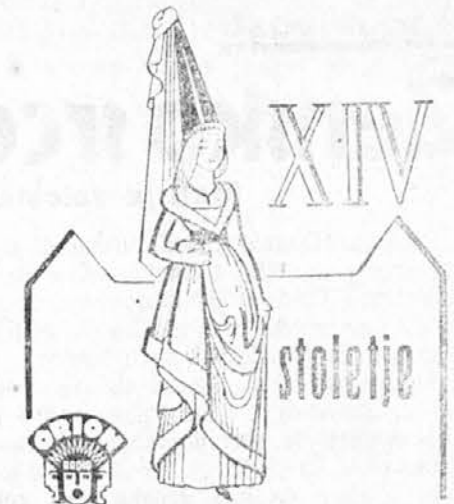
Zena je ona, ki določa okus in kulturo svojega časa. Za sodoben dom si izbere

Čeprav se je skrajšala povprečna oskrbna doba na minimum in nobena postelja ne ostane niti en dan prazna, še dolgo ni mogoče sprejemati vseh bolnikov, ki so potrebni bolniškega zdravljenja ter mora bolnišnica skoraj polovico bolnikov, ki se javljajo za sprejem, zdraviti ambulantno. To je dejstvo, ki je prisililo merodajne činitele, da so začeli iskati stavbišče za bolnišnico. Ker ni dovolj kredita, naj se postopoma zida nova bolnišnica, ki bo morala imeti najmanj za 300 bolnikov prostora in poseben trahomski oddelek, je že bil ustanovljen,