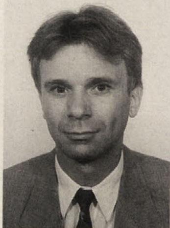
Piše dr. Kristijan Schellander

gov. »Avstrijski konzorcij«, ki je svojčas ponudil 12 milijard, bi mogel glede na novo ceno CA tudi razpasti, kajti simpattija do ljudske stranke je eno, gospodarska logika in dodatne milijarde pa drugo. Od mednarodnih interesentov pa imajo nekateri avstrijskih strankarskih iger kot rečeno že zadosti, drugi pa svojih namerov še niso jasno izrazili.