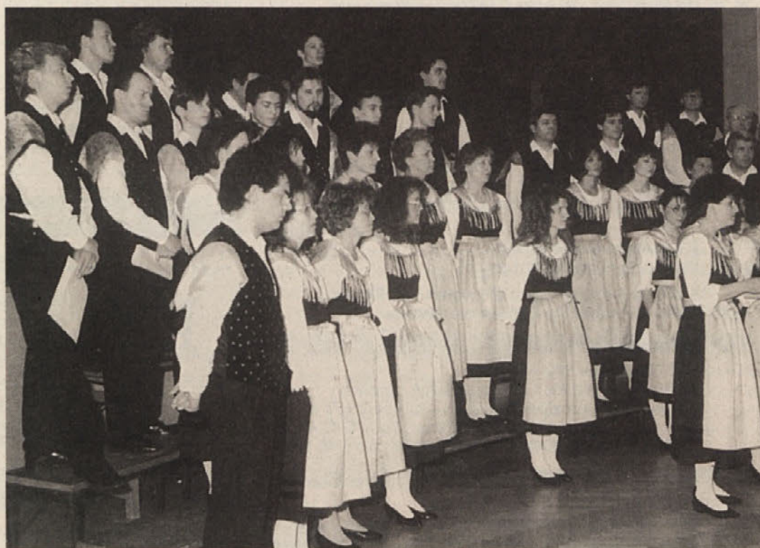
»Danica« opravlja zadnje nastope pred turnejo po severni Ameriki

Ob toplem poletnem večeru se je v Breznikovem kampu ob Zablatniškem jezeru zbralo precej ljudi, da bi prisluhnili koncertu, ki so ga oblikovali poleg MePZ SPD »Danica« še MoPZ SPD »Valentin Polanšek« in trio saksofonistov. SPD »Danica« ta kulturni večer prireja že trideset let.