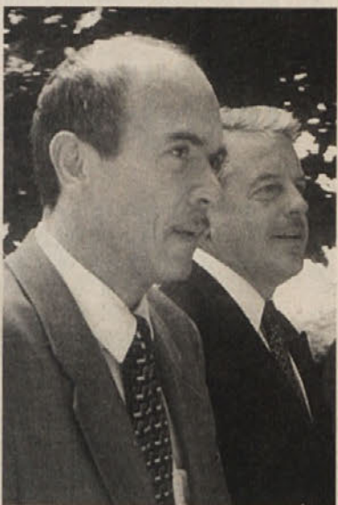
S srečanja predsednikov vlad Janeza Drnovška in Franza Vranitzkega

Oba, Drnovšek in Vranitzky, se zavzemata za mirno reševanje pro- blemov na Balkanu oz. v Krajini, vendar se v napoved nadaljnjih dogodkov nista spuščala. Sloveni-