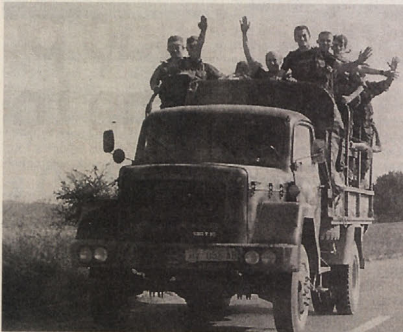
Zmagoslavje hrvaške vojske ob hitrem prodiranju v Krajino

ljenju. To pa bo glede na nepripravljenost obeh strani zelo težko, zato po vsej logiki miru še ne bo.