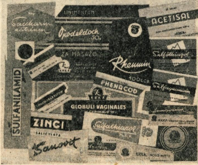
Izdelki farmacevtskega laboratorija »KRKA«