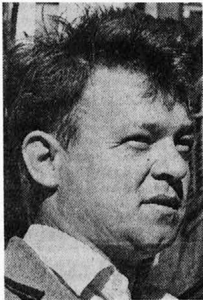
Pokojni pisatelj Pavle Zidar

V Ljubljani je 13. avgusta umrl velik in morda najbolj plodovit pisatelj vseh časov na Slovenskem, Pavle Zidar. Rodil se je z imenom Zdravko Slamnik 6. januarja leta 1932, na Slovenskem Javorniku pri Jesenicah. Po mučni in revni mladosti je končno prišel do učiteljskega poklica, ki ga pa je kaj kmalu opustil in se ves predal pisateljevanju. Na Slovenskem je bil med prvimi, ki se je odločil za svobodni pisateljski poklic, katerega je opravljal tako temeljito, da si je hitro nakopal jezo kolegov in kritike literarnih izvedencev in vseh tistih, ki mislijo, da to so, češ da piše preveč in prehitro.