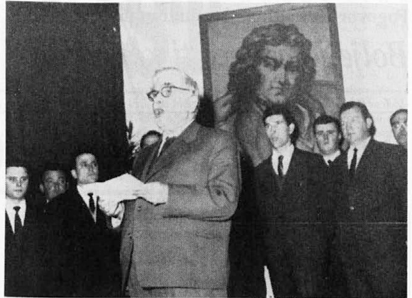
Na Prešernovi proslavi v organizaciji društva s Proseka in Kontovela je leta 1964 govoril pisatelj France Bevčar

KD Prosek-Kontovel je imelo svoj sedež v Kulturnem domu na Proseku, skupaj z ostalimi skupinami. Prostora je bilo za vse dovolj, za skupno delo pa se je bilo bolj težko dogovoriti. Trenutno